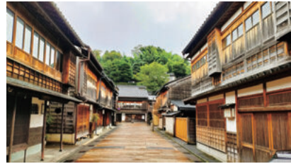
(「ひがし茶屋街」に見る金沢の歴史的まち並み)

問 金沢を「古都」と表現する土産物や、メディアの記事、番組が増えてきている。金沢は「城下町」だと国内外に伝わる本市らしい発信を速やかに打ち出すべきではないか。