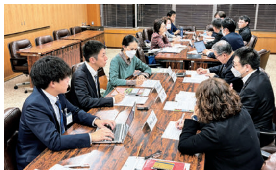
テーブルトークの様子