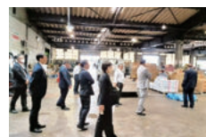
高崎市総合卸売市場