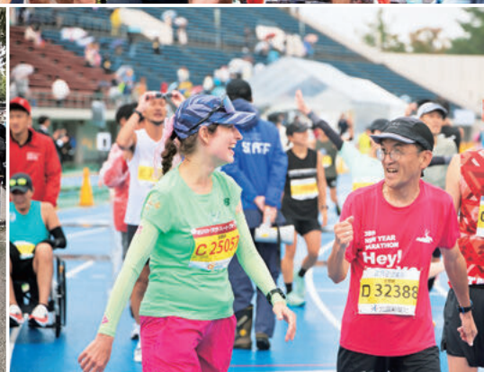
令和7年10月26日に開催された、金沢マラソン2025