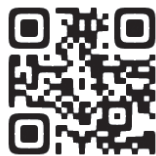
かなざわ保育ナビ

答 本市の保育施設の人材確保に影響を及ぼす可能性があり危機感を抱いている。本市の取組として魅力発信動画の作成のほか、保育士宿舎借上げ費補助事業、Uターン保育士就労支援事業、さらに今年度創設した奨学金返還支援制度により、人材確保に努めている。 (こども未来局長)