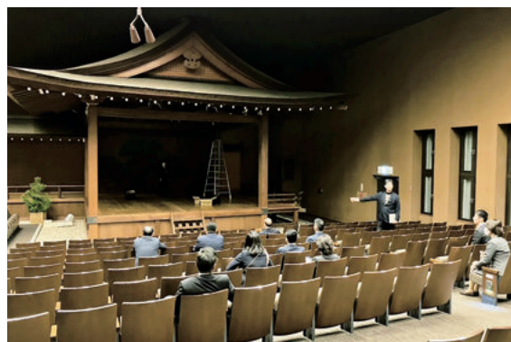
～宝生能楽堂を視察～