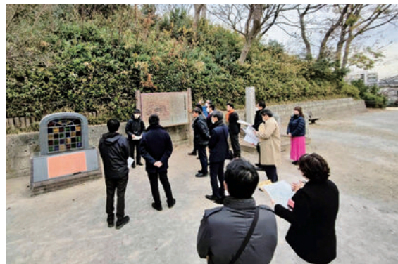
～史跡公園整備予定地を視察～