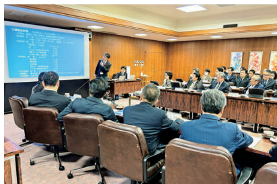
～令和6年能登半島地震の対応状況等について説明～