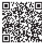
伊那市中学生キャリアフェス動画

問 長野県伊那市では毎年市内の全中学 2 年生を対象に、地域を知り、地域の人と触れ合い、地域の未来を考える日として、産官学連携でキャリアフェスを開催しているが、本市でも開催できないか。