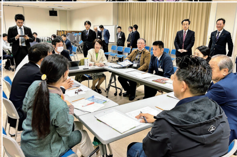
11月28日に教育プラザ富樫にて開催された、金沢市議会意見交換会の様子