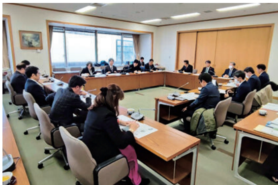
～板橋区史跡公園（仮称）整備について説明～