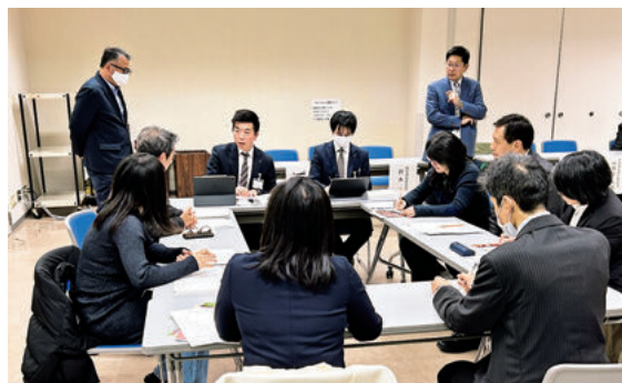
テーブルトーク方式による意見交換の様子