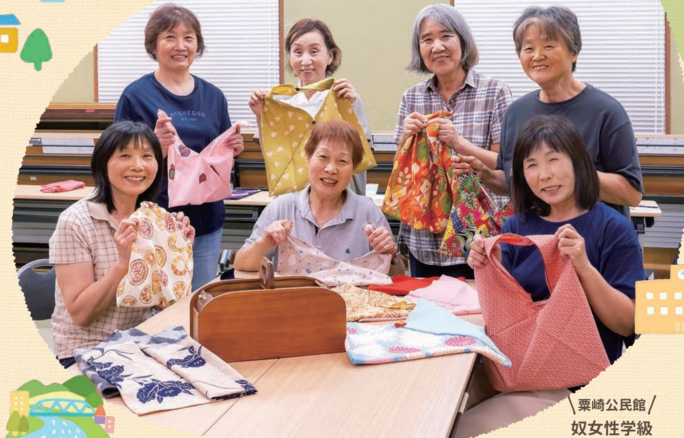
粟崎公民館 / 奴女性学級