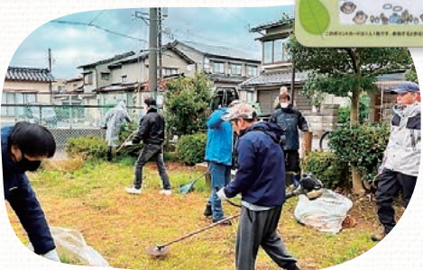
参加後、町会役員が参加者のポイントカードにスタンプを押します