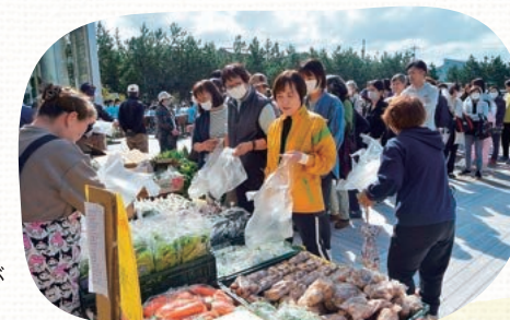
新鮮な野菜が並び日曜野菜市

このイベントはコロナ禍で失われた地域のコミュニティを取り戻そうと始まりました。令和4年から毎年10月に金沢市ものづくり会館を会場に開催しており、地域の住民による多彩なパフォーマンスがステージで披露されます。ほかにも地域の活性化を目的とした町会・諸団体による模擬店やゲームなど、趣向を凝らしたコーナーが並びます。令和6年には粟崎地区に被害をもたらした能登半島地震からの復旧・復興を願う企画も登場しました。当日は町内を回るシャトルバスも運行され、約3,000人が会場に足を運びました。