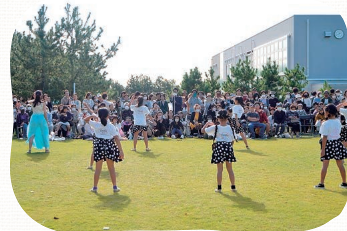
メインステージでは地域の団体がさまざまなパフォーマンスを披露