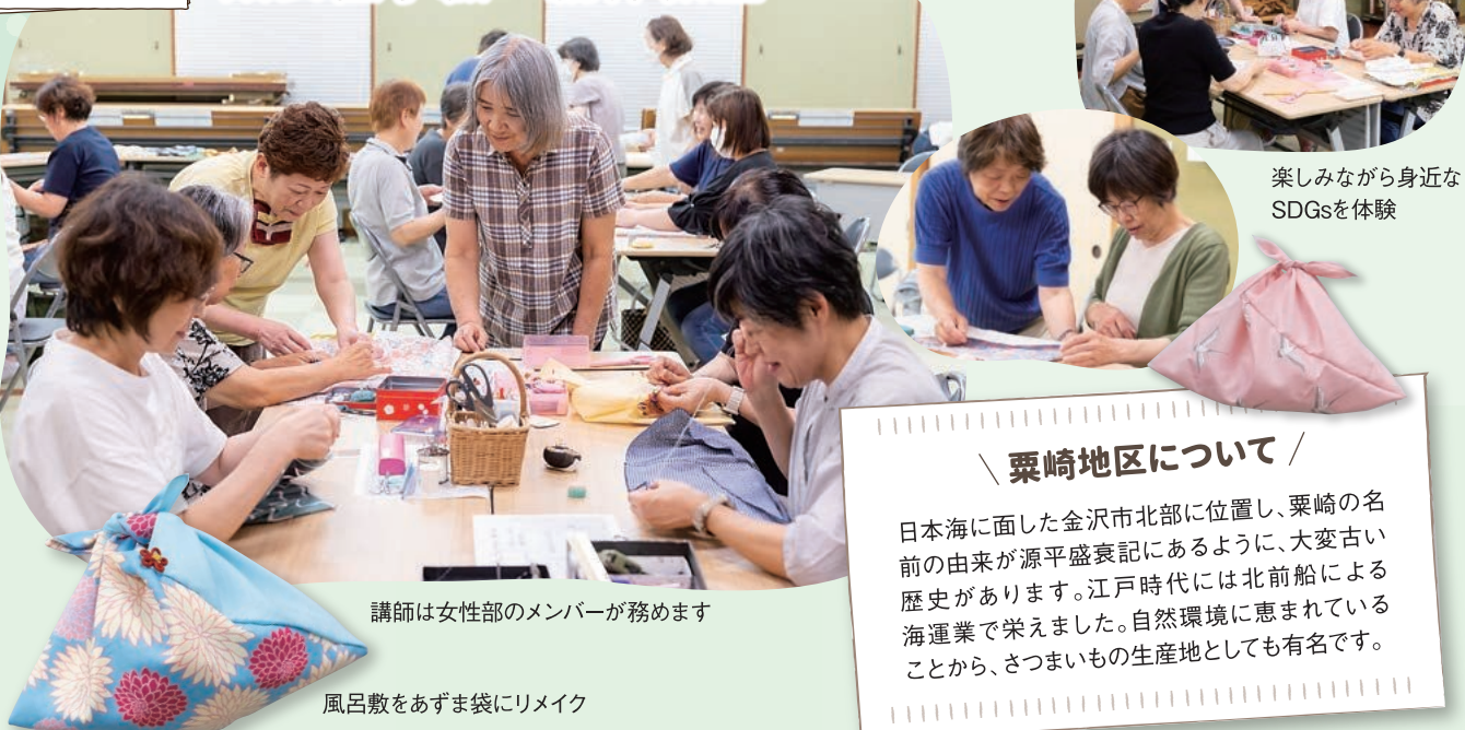
講師は女性部のメンバーが務めます