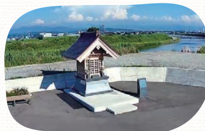
浅野川下流の左岸に祀られています