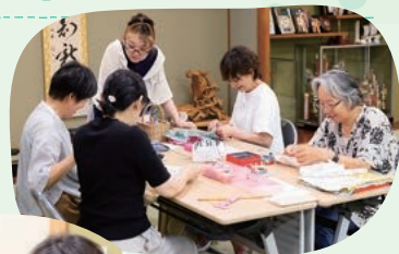
楽しみながら身近なSDGsを体験