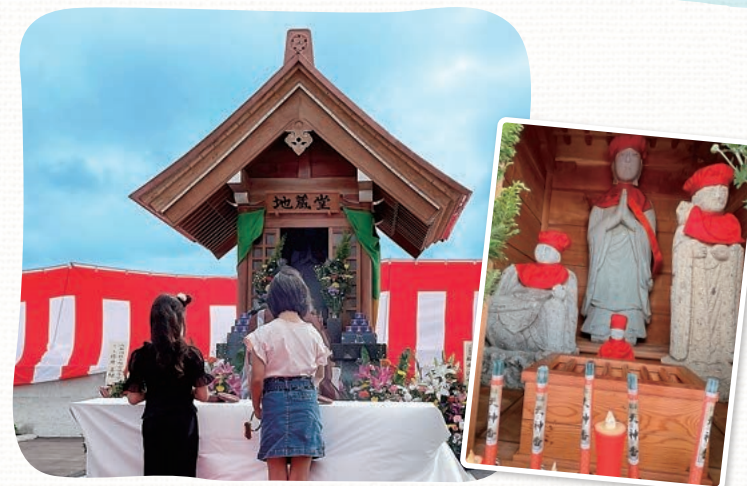
お地蔵さまの移設に伴い、新設された地蔵堂。俱利伽羅山の桜の木で造られ、浅野川校下地区を象徴する紋章(八羽紋)がデザインされています

南北に長い地域を、市民から「あさでん」と呼ばれる北陸鉄道浅野川線が走っています。令和7年には諸江地区の金沢市編入100周年を迎え、記念式典や記念誌の発行、100周年を大きく発信した夏祭りなど、さまざまな記念行事が行われています。