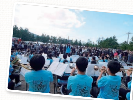
港中学校吹奏楽部による演奏