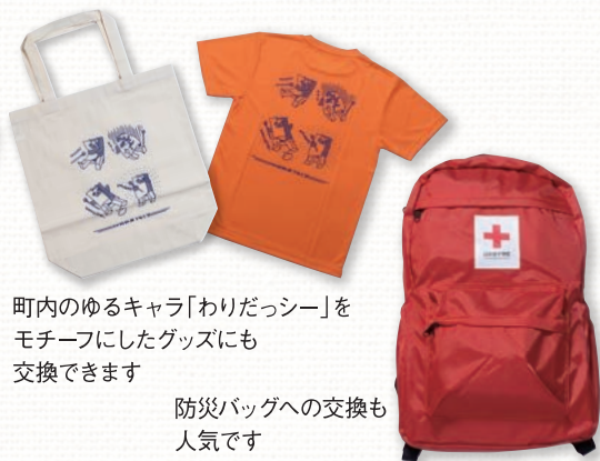
町内のゆるキャラ「わりだっシー」をモチーフにしたグッズにも交換できます