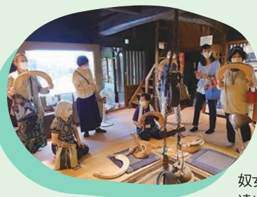
奴女性学級として県外への遠出も実施(写真:五箇山)