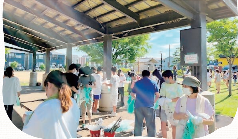
割出町公園での清掃活動