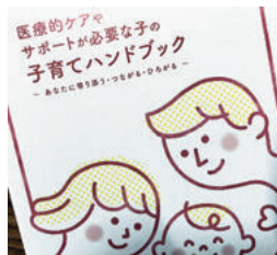
医療的ケアやサポートが必要な子の子育てハンドブック

答 本制度は認知度が十分でない課題があるため、支援情報をまとめたポータルサイト開設や医療的ケア児等の家族会と協働でハンドブックを作成・配布した。新年度は、日本小児保健協会学術集会へのブース出展等を通じて広報を強化し、コーディネーター間の連携強化と支援スキル向上に取り組む。(市長)