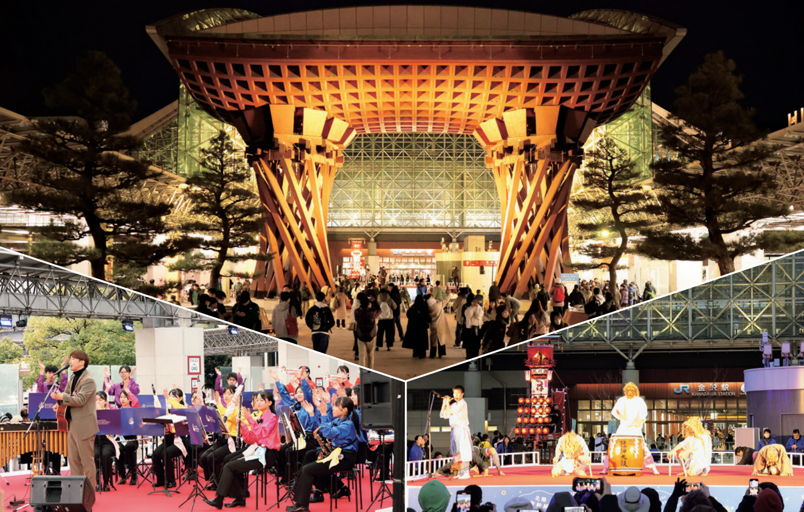
3月15日に行われた北陸新幹線開業10周年イベントの様子