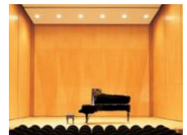
金沢市アートホール

答 金沢市アートホールなど3ホールのほか、市民芸術村などの施設があることから、施設の新設は考えていないが、今後とも、さまざまな催しに対応できるよう既存施設の一層の充実に努めたい。また、市内に所在するその他の官・民の既存施設の活用もお願いしたいと考えている。(市長)