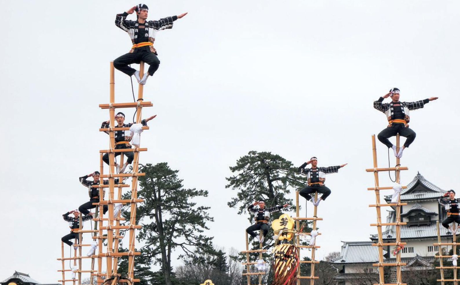
金沢市消防出初式での加賀鳶はしご登り演技