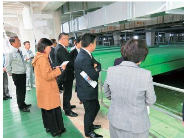
耐震化工事を実施した七ツ屋水管橋の視察