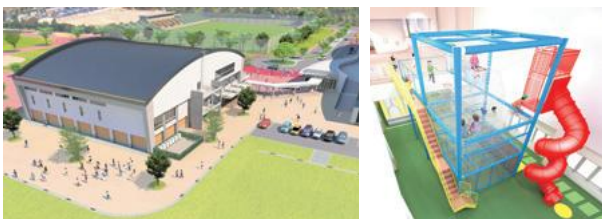
平成31年4月開業予定の城北市民運動公園屋内交流広場 (イメージ)

答 愛称の募集については、子どもから大人まで多くの人に親しみを持ってもらう有効な手段だと思っており、平成 31 年 4 月に予定している供用開始前までに前向きに検討したい。(市長)