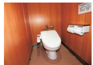
新設された泉小学校の洋式トイレ