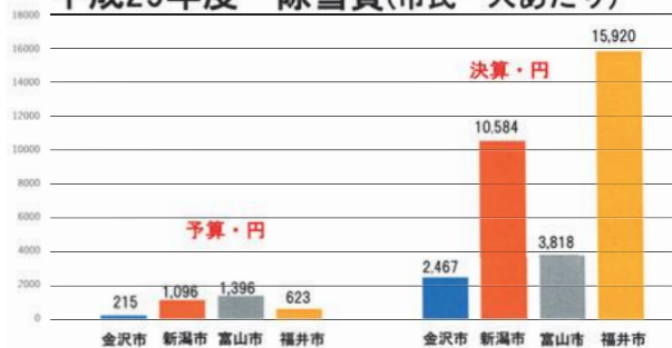
平成29年度 除雪費(市民一人あたり)

常設排雪場を県・市合わせ 12 カ所確保し、大雪時は学校施設や大規模公園等を臨時排雪場として開設する。国・県・事業者・市民と力を合わせ、市としてなし得る限りの施策に取り組んでいく。 (市長)