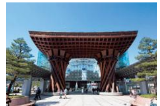
金沢駅鼓門

答 この機を逃さずに交流人口の拡大を図るため、歴史、伝統、文化など、まちの魅力をより一層磨き高めていくことが大切である。地元の方が誇りを持ち、楽しめるまちをつくっていくことで、他都市の方からも評価してもらえるまちになっていくと思っている。(市長)