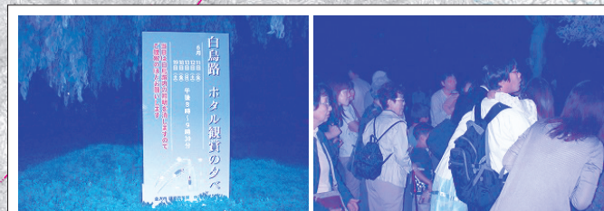
白鳥路のせせらぎでは、毎年たくさんのホタルが観られます。白鳥路ホタル友の会や金沢ホタルの会の協力により、ホタル観望の夕べが開催されました。

この間に産卵し、一生を終えます。捕まえて持ち帰ると、数が減少してしまいますので、見て楽しんで、観察するだけにしてください。