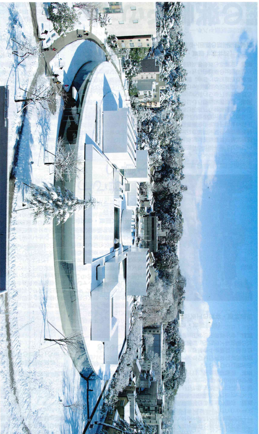
公立の文化施設を対象とする地域創造大賞(総務大臣賞)に選ばれた金沢21世紀美術館

平成27年(2015年)2月1日 編集●金沢市議会事務局 発行●金沢市議会 金沢市広坂 1-1-1 TEL (076)220-2392 FAX (076)260-7190 〈ホームページ〉 http://www4.city.kanazawa.lg.jp/41004/index.html