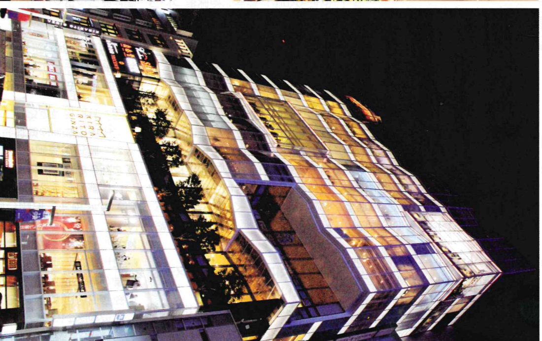
10月30日に東京・銀座にオープンした金沢クラフト首都圏魅力発信拠点「デザインング ギャラリー」【銀座の金沢】