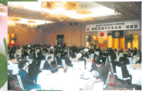
■開設10周年記念式典・祝賀会