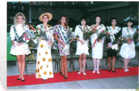
■1989ミスインターナショナル来場