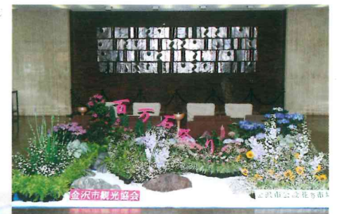
■百万石まつり協賛「花壇設置事業」