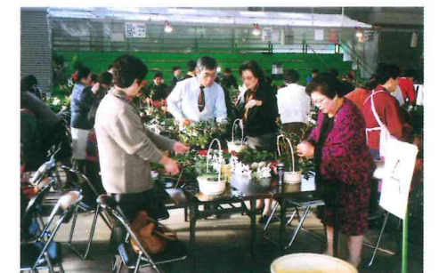
■フラワーアレンジメント体験研修会