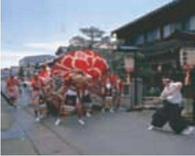
獅子舞 Lion Dance