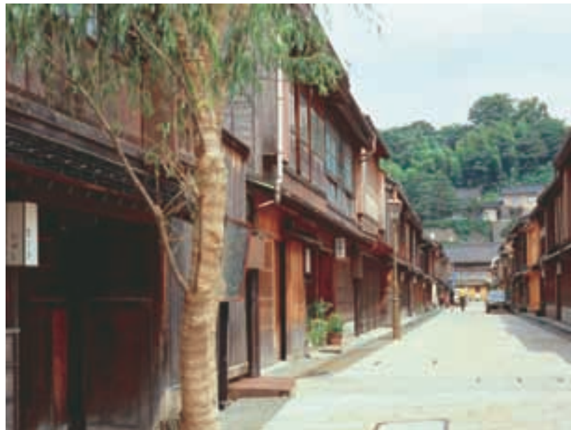
ひがし茶屋街 Higashi Chaya District