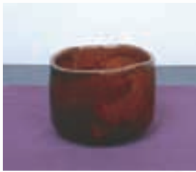
茶碗 Tea Cup