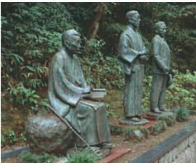
三文豪像 Three Great Men of Literature