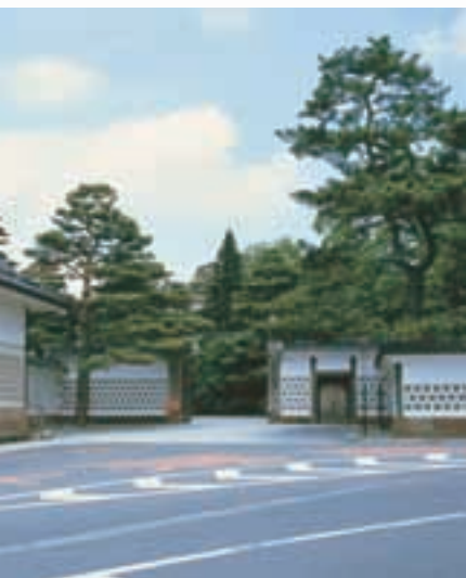
成巽閣 Seisonkaku Villa