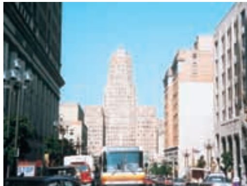
バッファロー市 (米国) Buffalo, U.S.A.