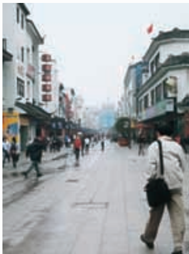
蘇州市 (中国) Suzhou, CHINA

가나자와는 전세계 7개 도시와 자매도시·1개 도시와 우호교류도시 관계에 있으며, 문화, 스포츠, 청소년 교류 등 여러 교류를 행하고 있습니다. 시내의 자매도시 공원에는 각 도시를 테마로 한 기념물, 자매도시 시장으로부터의 메시지를 새긴 평화 도시 선언비가 있습니다. 이즈미노 도서관에는 자매도시에서 수집한 도서가 소장되어 있으며 또한 유엔 위탁 도서관으로 유엔 관련 도서를 시민들이 폭넓게 이용하고 있습니다.