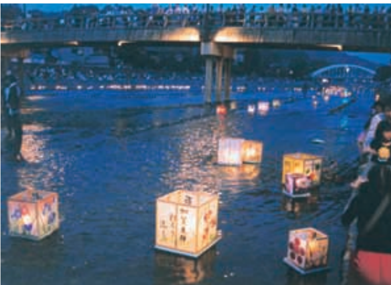
燈ろう流し Floating Lanterns