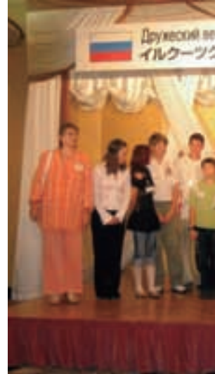
中学生相互派遣事業