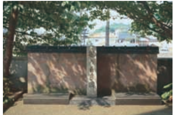
瀧の白糸碑 Literature Monument