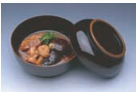
金沢の郷土料理 Kanazawa Cuisine