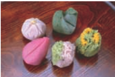
生菓子 Delicate Sweets