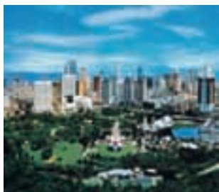
大連市 (中国) Dalian, CHINA