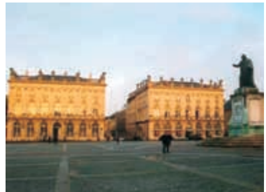
ナンシー市 (フランス) Nancy, FRANCE