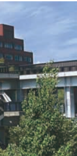
金沢大学 Kanazawa University