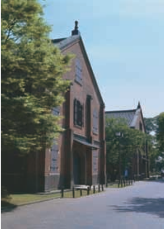
石川県立歴史博物館 Ishikawa Prefectural History Museum