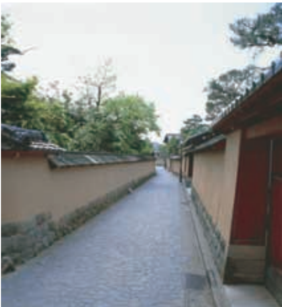
長町武家屋敷跡 Nagamachi Samurai Houses