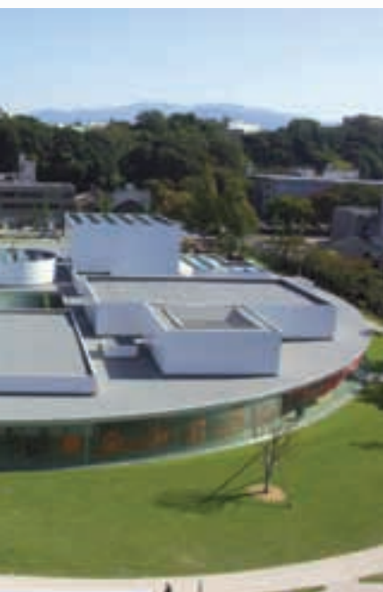
21st Century Museum of Contemporary Art, Kanazawa

현재 가나자와에는 약 45만명이 살고 있습니다. 또한 교외에는 베드타운이 몇 개 형성되어 있어 낮 동안의 인구는 50만 명에 달합니다. IT산업, 기계, 섬유, 전통 산업 등 다채로운 산업이 호황을 이루고 있습니다.