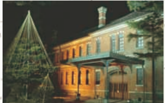
石川四高記念文化交流館 The Fourth High School Memorial Museum of Cultural Exchange, Ishikawa