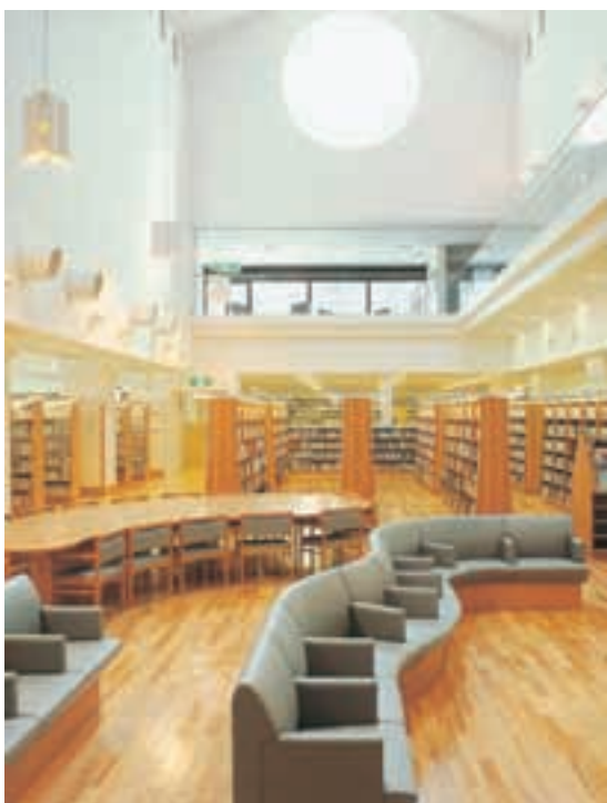
金沢市立泉野図書館 Kanazawa Izumino Library