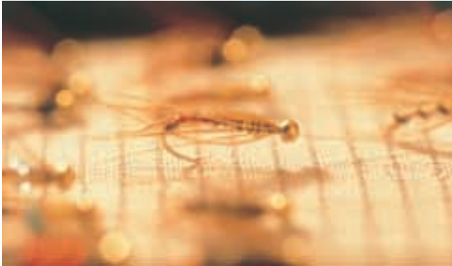
毛針 Fly Fishing Handicrafts