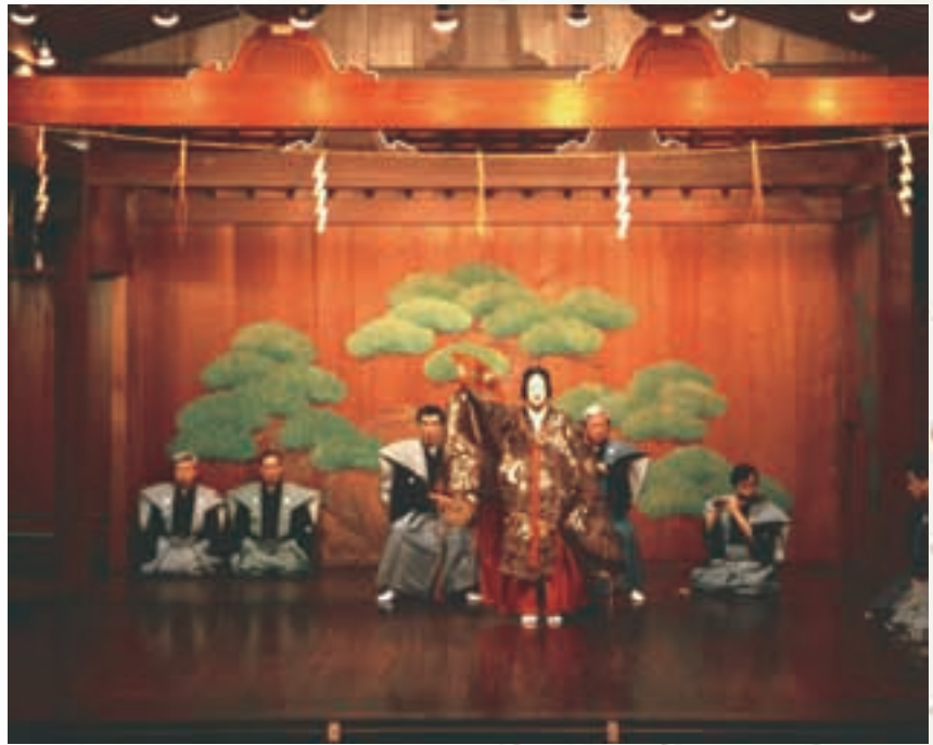
能舞台 Noh Theater