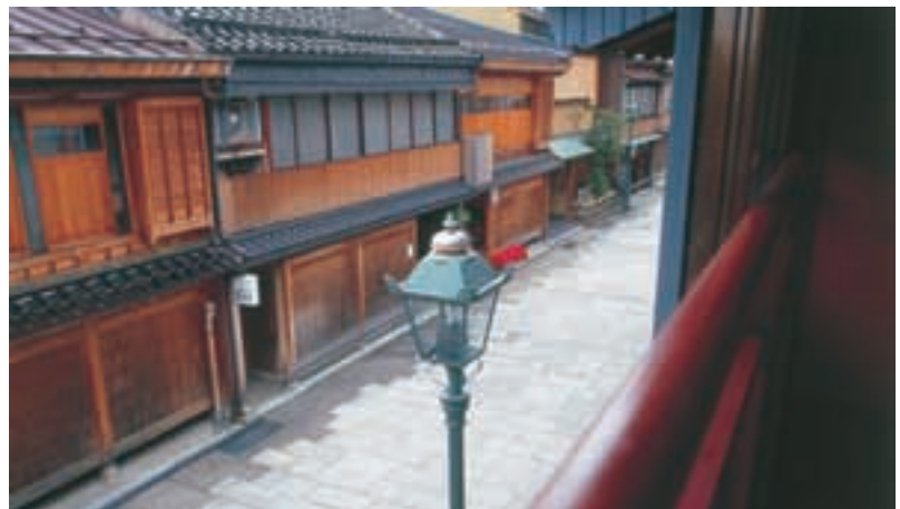
にし茶屋街 Nishi Chaya District