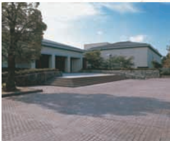
石川県立美術館 Ishikawa Prefectural Museum of Arts