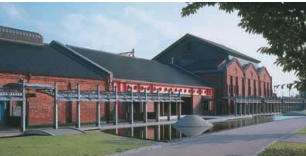
金沢市民芸術村 Kanazawa Citizen's Art Center