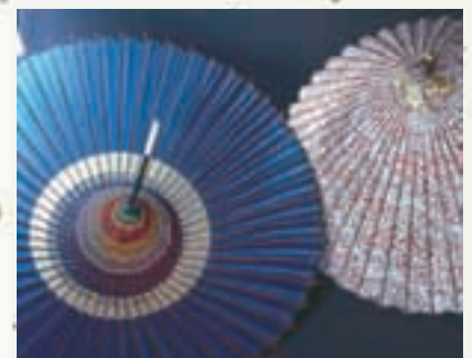
金沢和傘 Japanese Paper Umbrellas

가나자와에서는 구타니야키 도자기, 가나자와 하쿠, 가가 마키에, 가가 유젠 등 여러 미술 공예 기술이 연마되었으며, 현재도 많은 작가들이 활약하고 있습니다. 또한 가나자와는 3문호라고 불리는 무로우 사이세이, 이즈미 쿄카, 도쿠다 슈세이를 비롯해 가나자와와 인연이 있는 문인도 많이 배출했습니다. 더욱이 가나자와에 거점을 두고 활약하고 있는 <오케스트라 앙상블 가나자와>는 세계적으로도 높은 평가를 받고 있습니다.