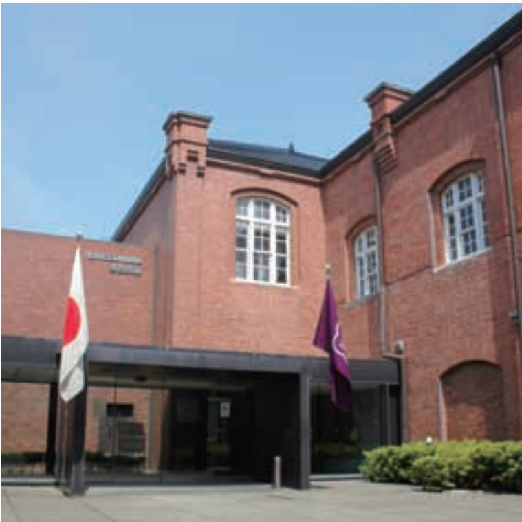
金沢市立玉川図書館 Kanazawa Tamagawa Library