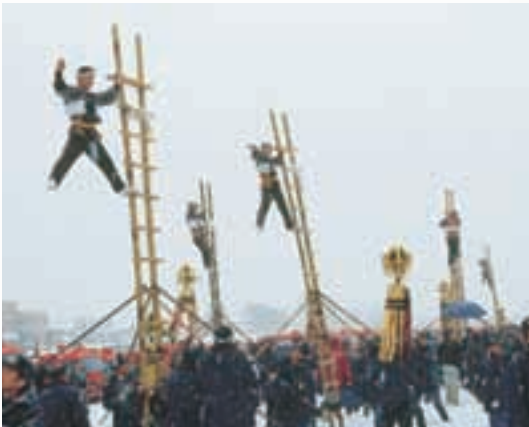
加賀鳶はしご登り Traditional Acrobatics of the Kaga Firemen