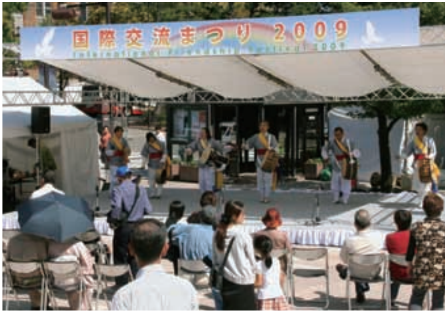
国際交流まつり International Friendship Festival