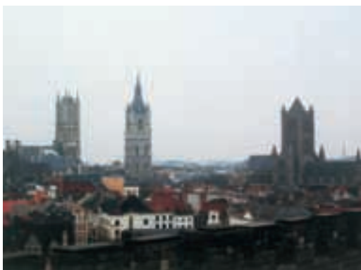
гент市 (ベルギー) Ghent, BELGIUM