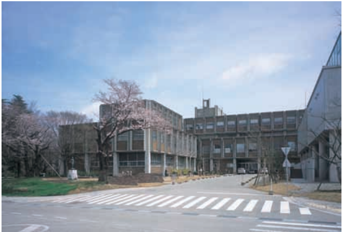
金沢美術工芸大学 Kanazawa College of Art