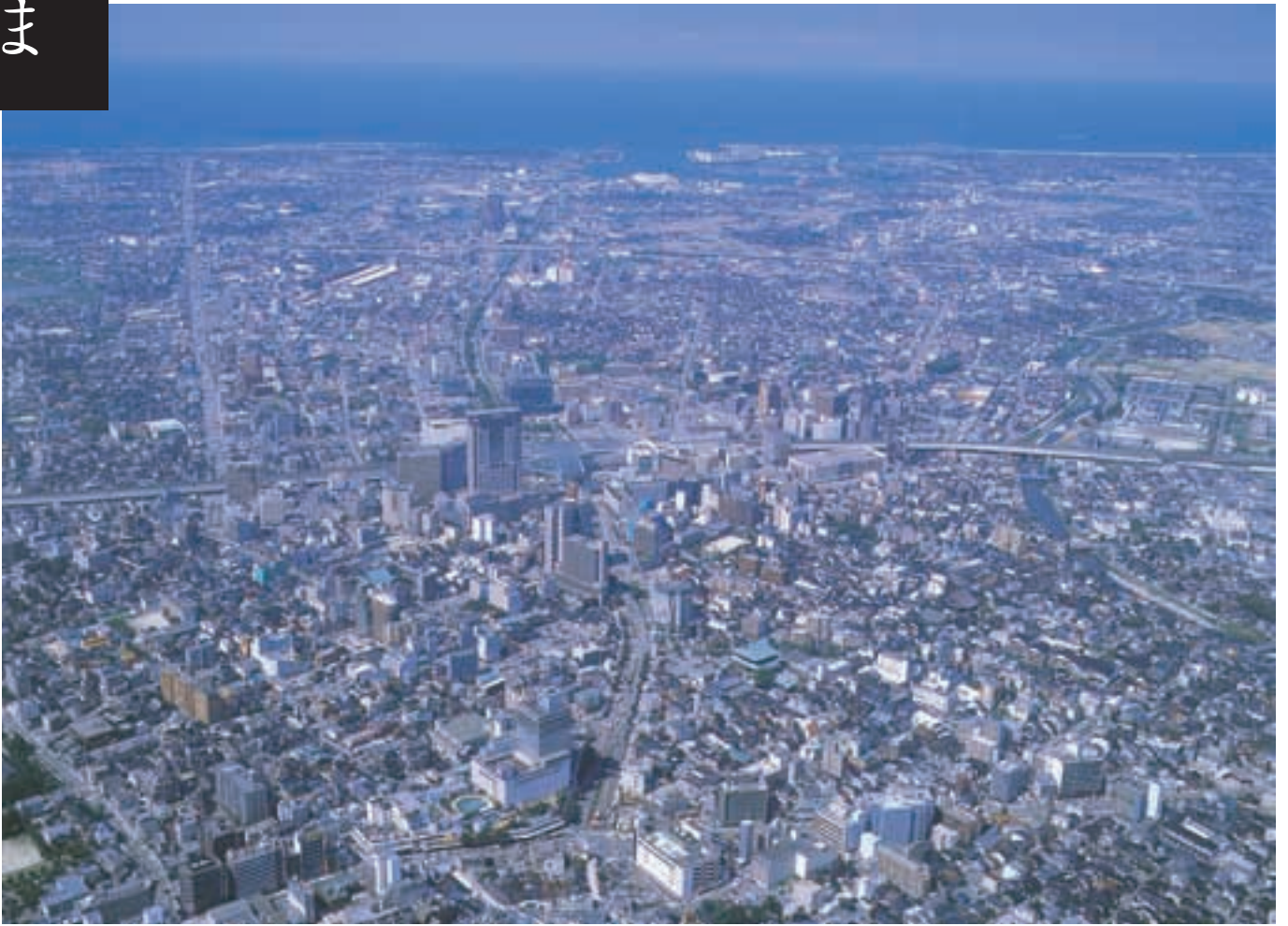
金沢市西部 Western Area of Kanazawa