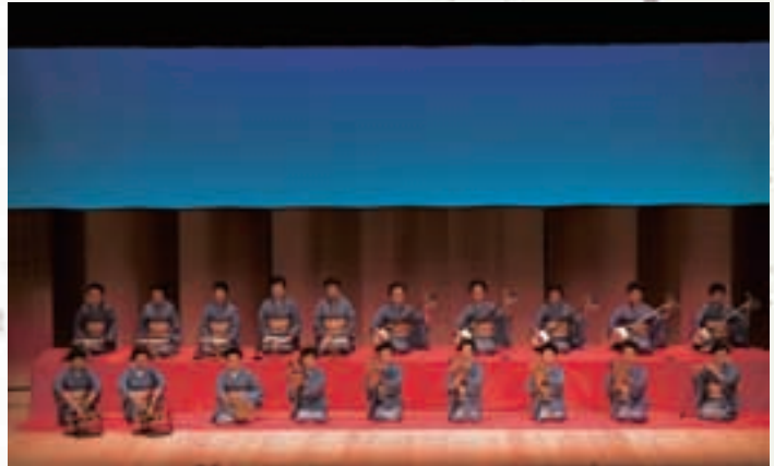
素囃子 Traditional Instruments