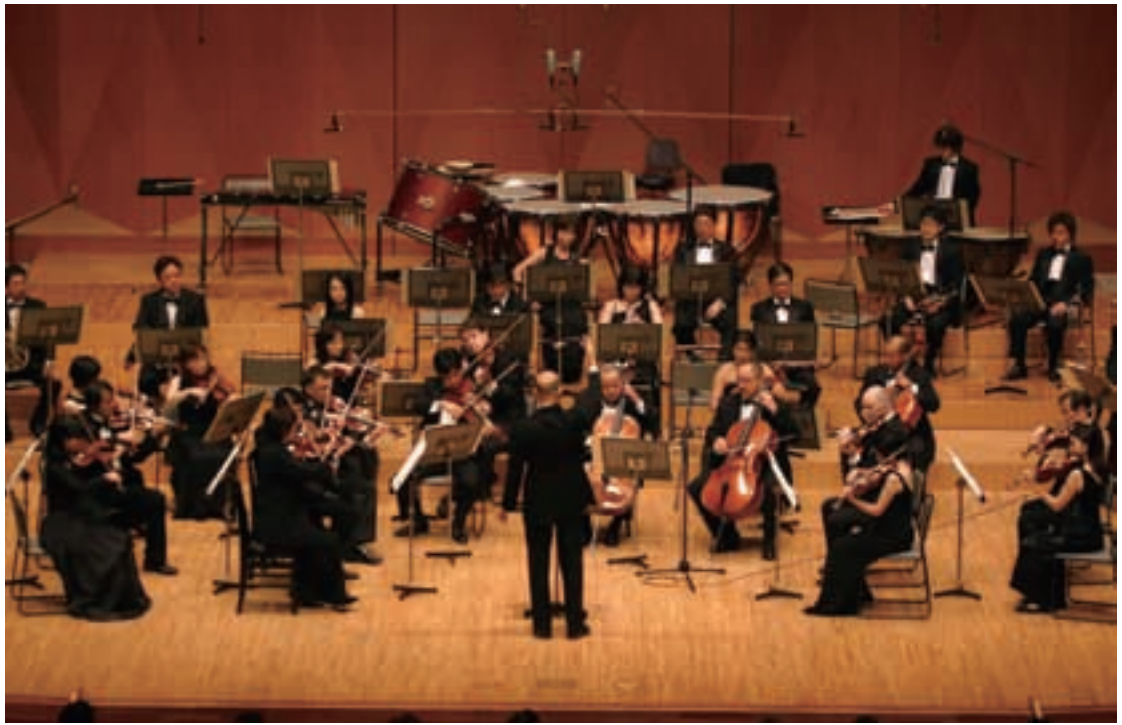
オーケストラ・アンサンブル金沢 The Orchestra Ensemble Kanazawa