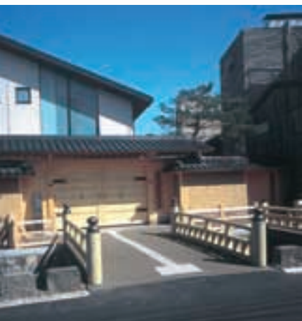
前田土佐守家資料館 Maeda Tosanokami-ke Museum