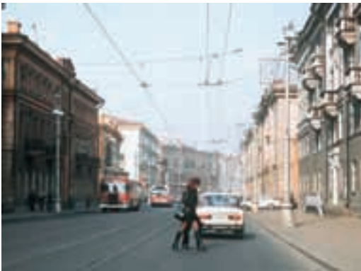
イルクーツク市 (ロシア) Irkutsk, RUSSIA