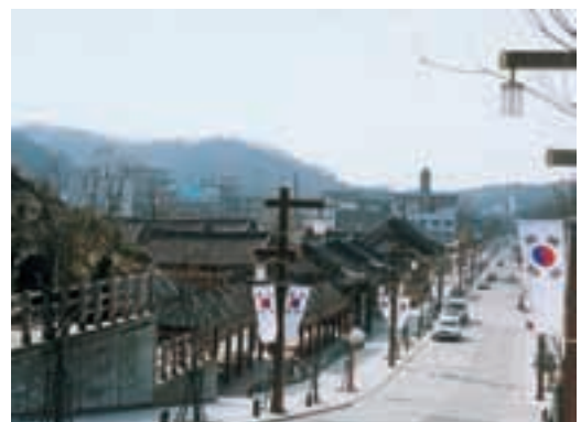
全州市 (韓国) Jeonju, KOREA