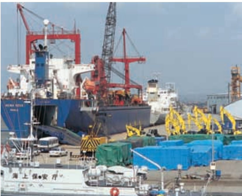
金沢港 Kanazawa Port