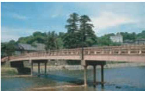
浅野川 Asano-gawa River