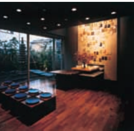
室生屋星記念館 Murou Saisei Kinenkan Museum