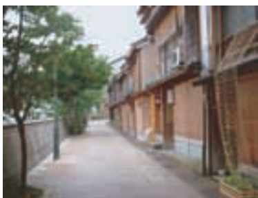
主計町茶屋街 Kazuemachi Chaya District