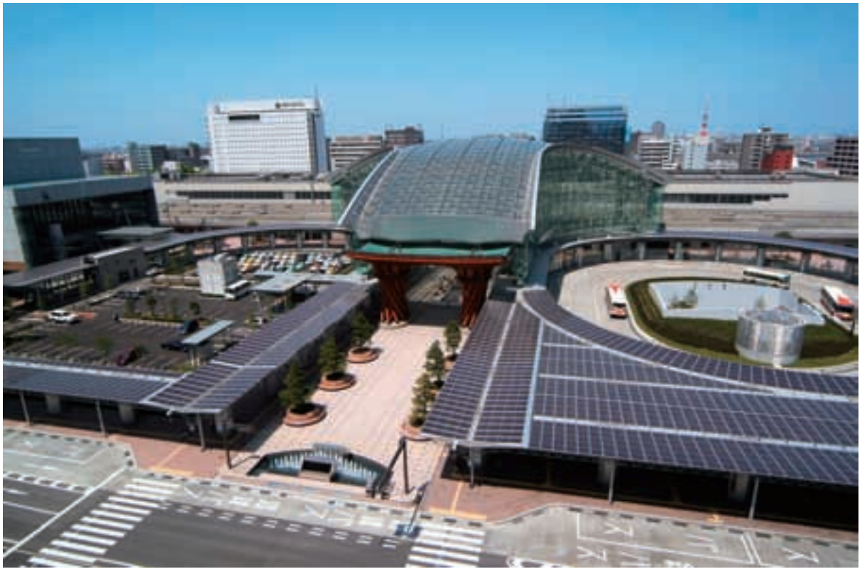
金沢駅 Kanazawa Station