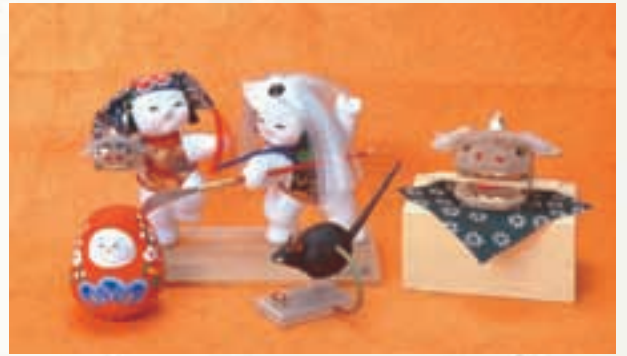
郷土玩具 Local Toys