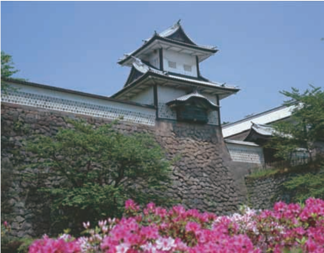
石川門 Ishikawa-mon Gate