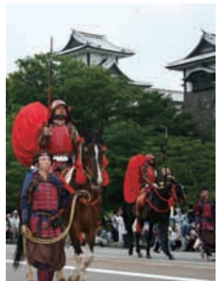
百万石まつり The Hyakumangoku Festival