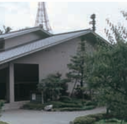
中村記念美術館 Nakamura Memorial Museum