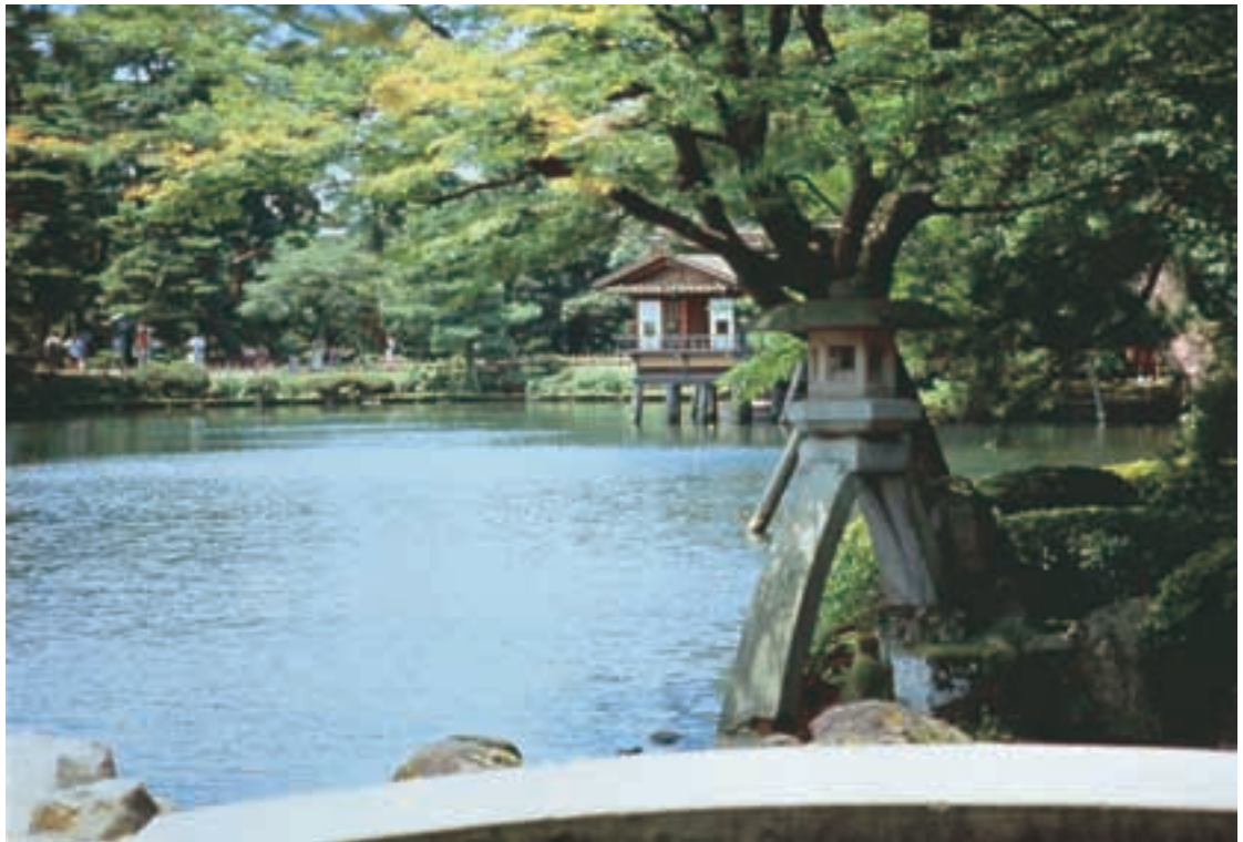
兼六園 Kenrokuen Garden