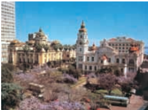
ポルト・アレグレ市 (ブラジル) Porto Alegre, BRAZIL