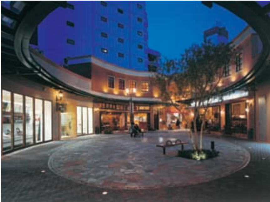
プレーゴ European Style Mall "Prego"