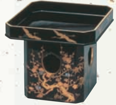
伝統工芸品 Traditional Crafts