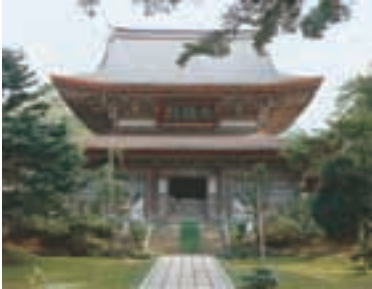
大乘寺 Daijōji Temple

현재 가나자와의 특징은 에도시대 약 280년 간에 걸쳐 만들어졌습니다. 도쿄, 오사카, 교토 다음으로 많은 사람들이 살았던 대단히 번성할 마을이었습니다. 그 세력을 우려한 에도 막부(도쿄 중앙정부)가 엄격히 감시했기 때문에 역대 가가 번주(가가 지방의 영주)는 공예 장려 및 미술품 수집 등 문화 진흥에 힘을 기울였습니다. 또한 학문에도 열심으로 일본 전국에서 서적을 모았기 때문에 천하 서부(많은 책을 소유하고 있는 도시)로써도 유명해졌습니다. 제2차 세계대전의 전화를 입지않았기 때문에 현재에도 당시의 마을 모습이 남아 있습니다.