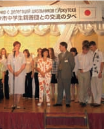
International Friendship Exchange