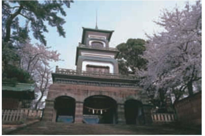
尾山神社 Oyama Shrine