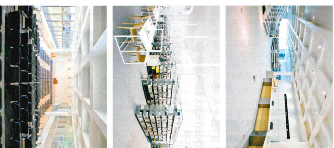
5月21日にオープンする金沢海みらい図書館(寺中町)