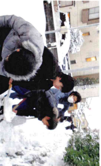
学生雪かきボランティアの様子