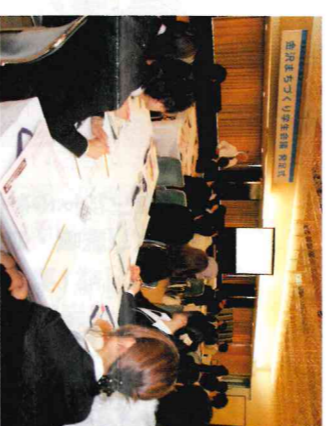
金沢まちづくり学生会議