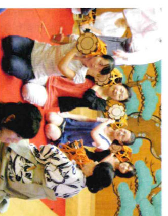
学都金沢絆キャンパス事業「能楽入門」