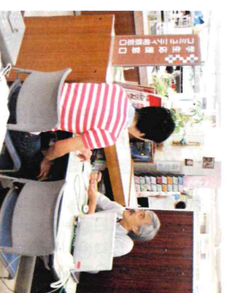
学生応援窓口 (市役所3階)