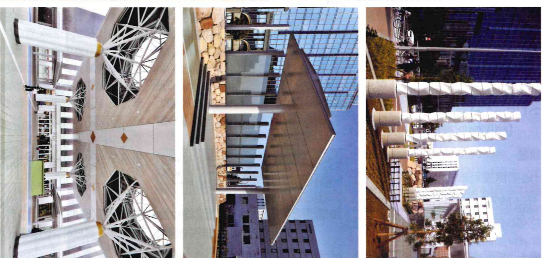
再整備した金沢駅西広場