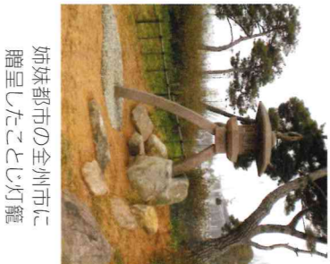
姉妹都市の全州市に贈呈したことじ灯籠

質問 固定資産税及び市民税見直しのことじ灯籠の贈呈について、ホルト・アングラ市の意向を踏まえ、適切な時期にできるよう検討したい。