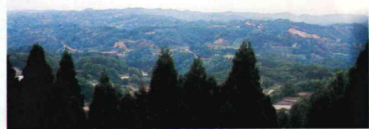
松根城址からの展望

こもっています。一向一揆の頃に使われた後、天正12(1584)年の前田氏と佐々氏との戦いに使われたのが最後です。