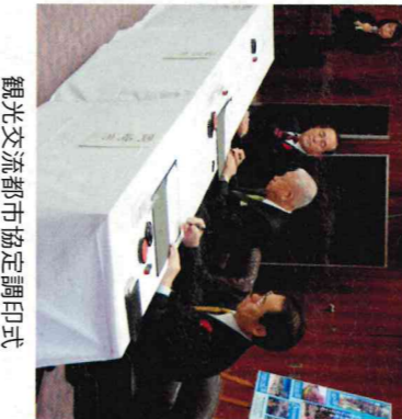
観光交流都市協定調印式

質問 企業誘致にインフラ整備は重要である。現在、金沢港の大水深岸壁や環状道路の整備などが行われて、さらに出店予定があるが、県が積極的に出店調整するよう働きかけ