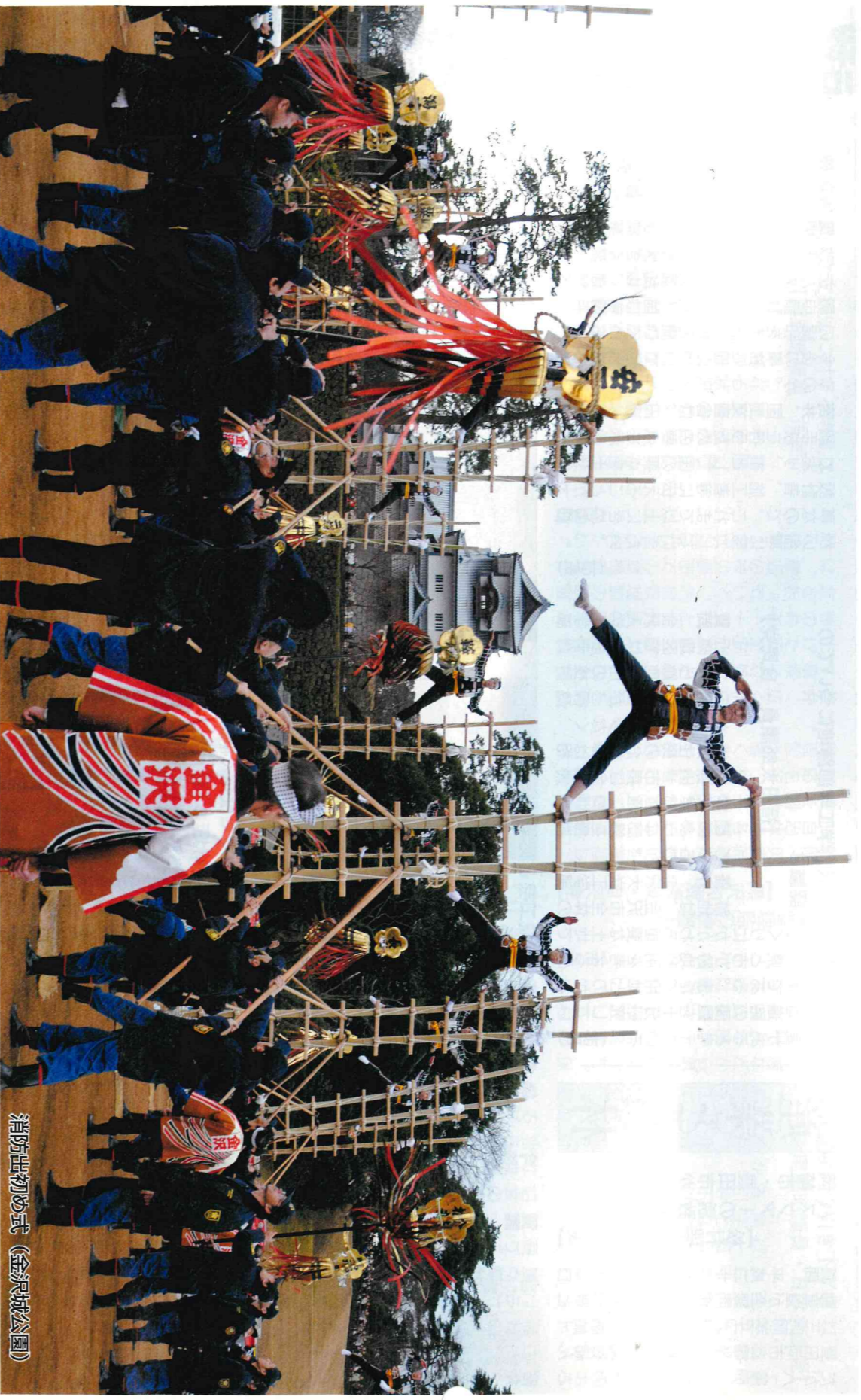
消防出初め式(金沢城公園)

〈インターネットアドレス〉 http://www4.city.kanazawa.lg.jp/41004/index.jsp