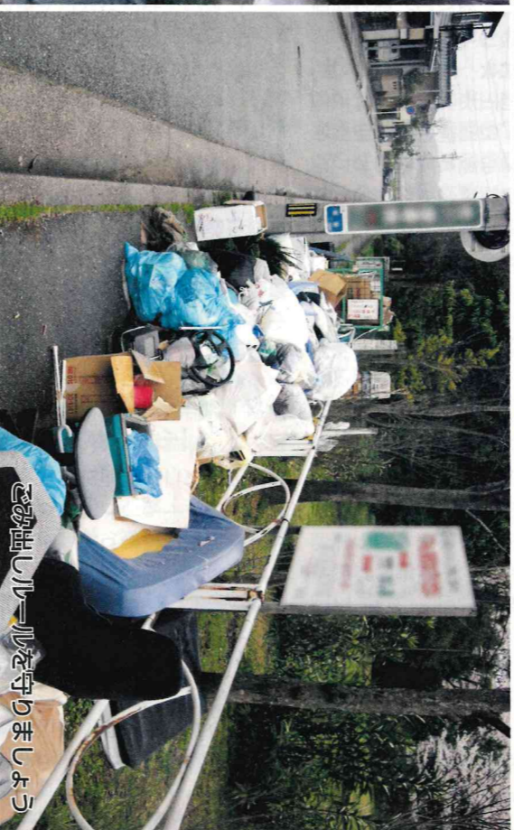
ごみ出しルールを守りましょう