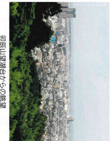
卯辰山望湖台からの眺望