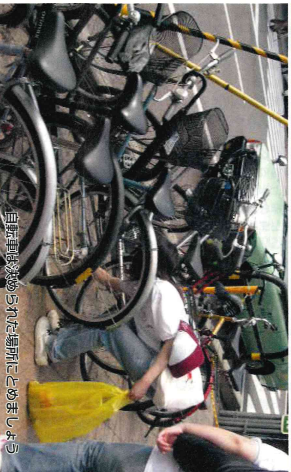
自転車は決められた場所にとめましょう