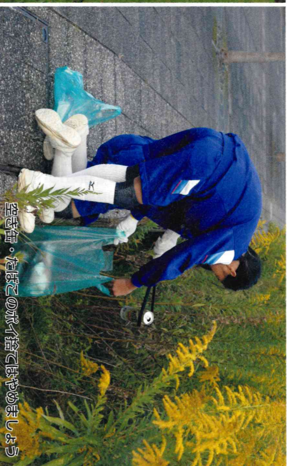
空き缶。たばこの灰は捨てましょう