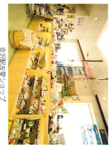
金沢駅友愛シヨック

市議会だよりは、定例会のあらしや議会の活動をお知らせするため、年4回お届けします。