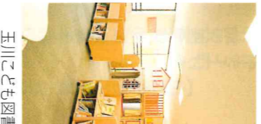
玉川こども図書館 世界の絵本コーナー」