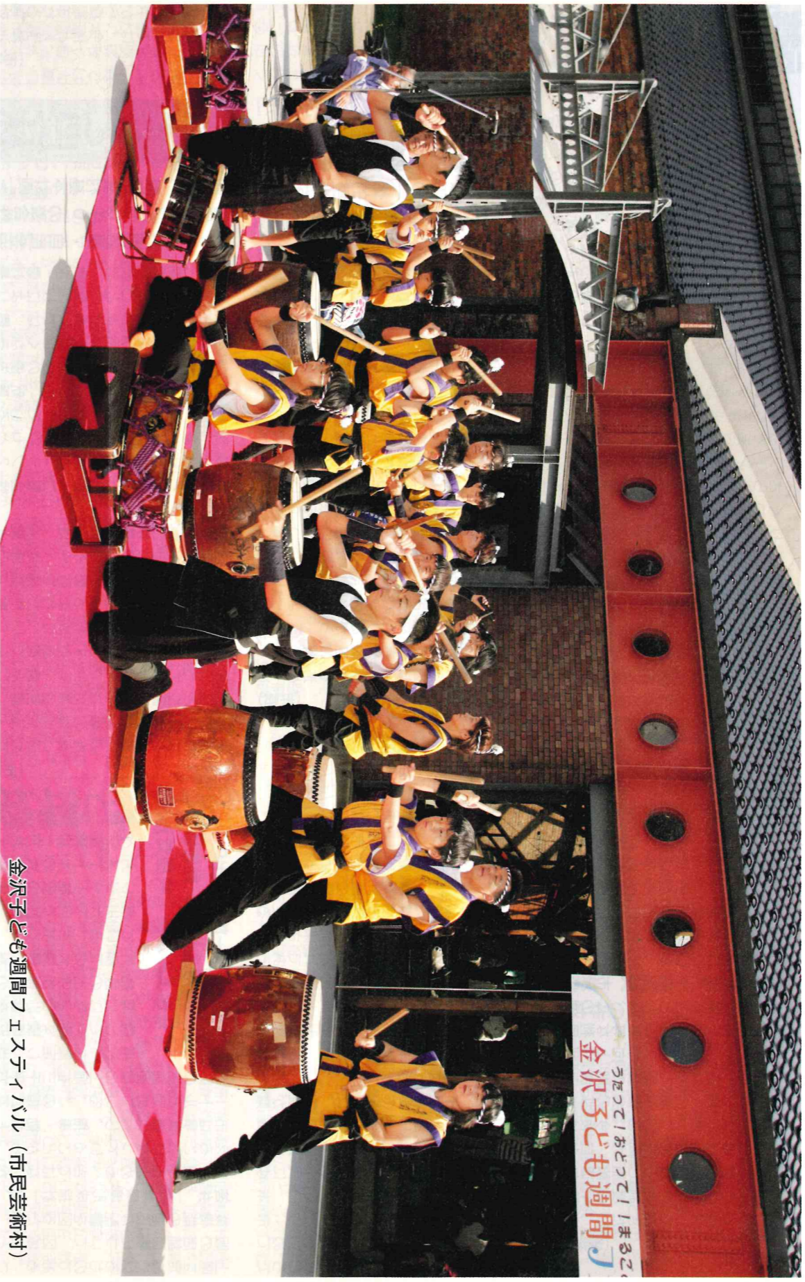
金沢子ども週間フェスティバル(市民芸術村)

〈インターネットアドレス〉 http://www.city.kanazawa.ishikawa.jp/gikai/index.htm