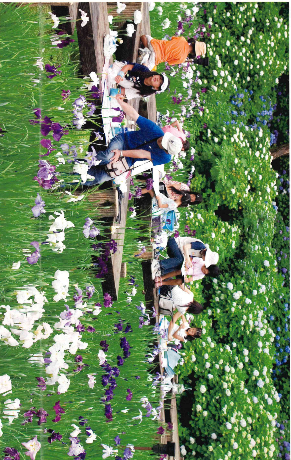
卯辰山公園花菖蒲園写生会