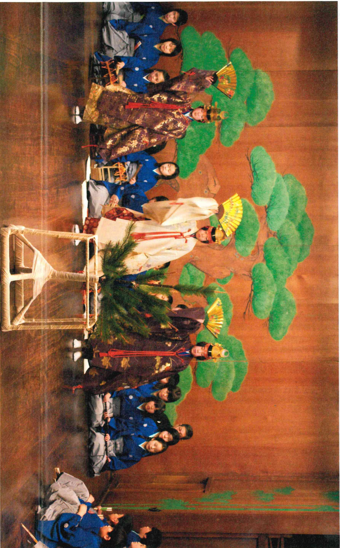
加賀宝生子ども塾発表会