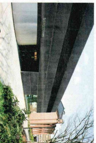
金沢市立玉川図書館