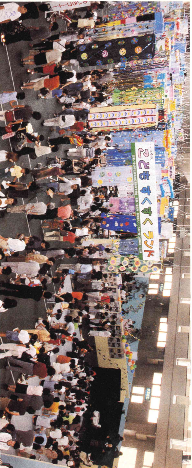
6月30日に開催された「こどもすくすくランド」

平成14年(2002年)8月1日 編集●金沢市議会事務局 発行●金沢市議会 金沢市広坂1-1-1 ☎(076)220-2392 〈インターネットアドレス〉 http://www.city.kanazawa.ishikawa.jp/gikai/index.htm