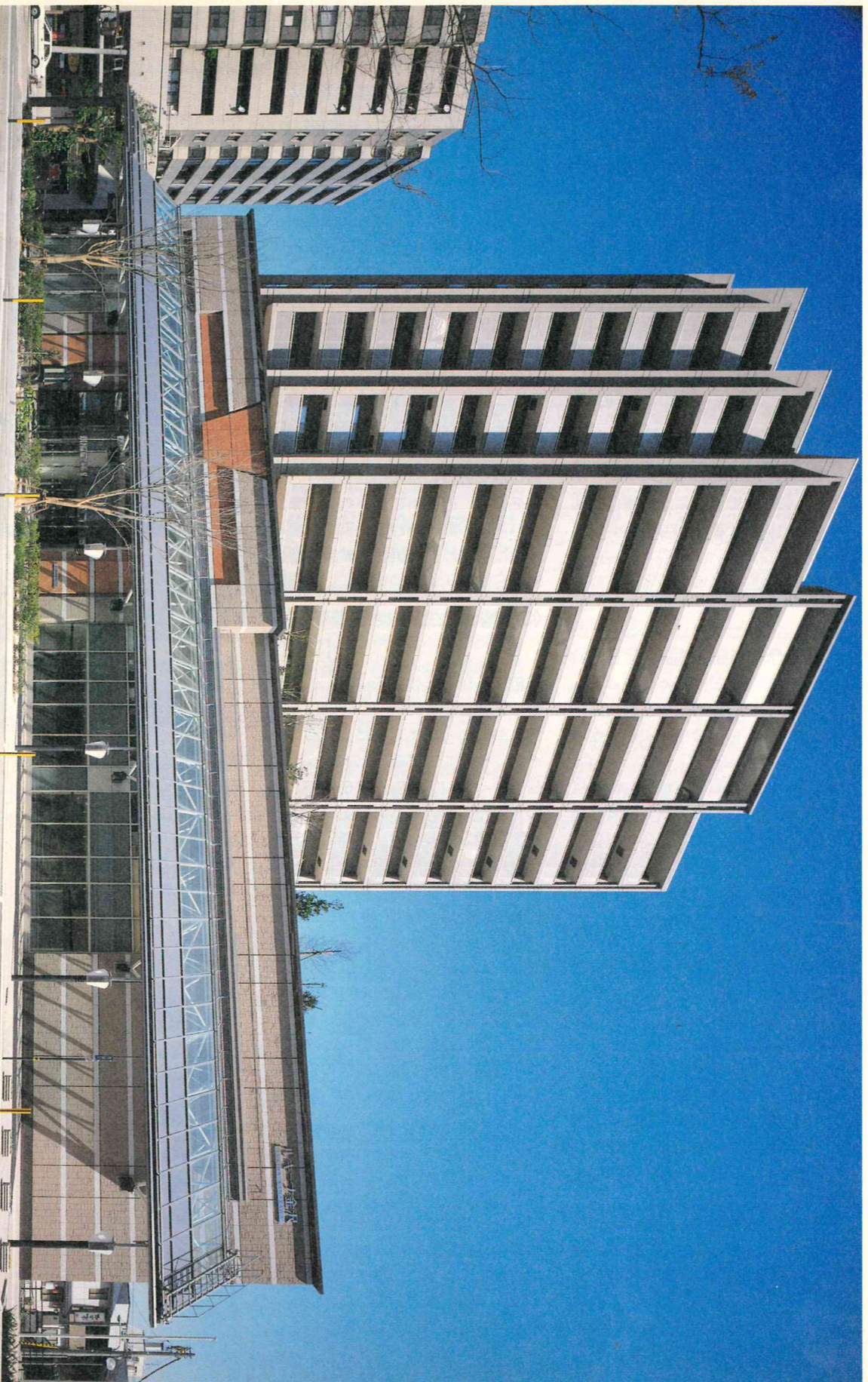
4月18日に竣工したルキーナ金沢

平成14年(2002年)5月1日 編集●金沢市議会事務局 発行●金沢市議会 金沢市広坂1-1-1 ☎(076)220-2392 (インターネットアドレス) http://www.city.kanazawa.ishikawa.jp/gikai/index.htm