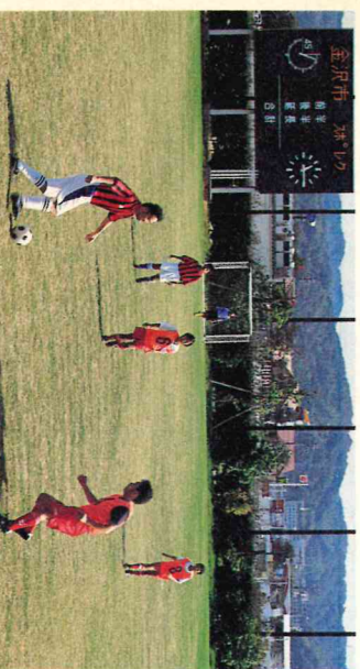
市民スポーツ・レクリエーション祭(市民サッカー場)

質問 本市を取り巻く経済状況が一段と厳しさを増す中、地元企業の育成・支援高年齢者雇用促進事業の内容を伺う。