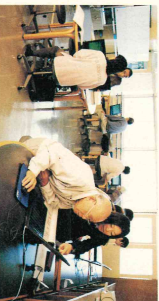
IT講習会(長坂台小学校)

質問 平成十四年度の政府予算原案がまどめられ、来年度予算編成では新規国債発行額が三十兆円以下に抑えられる。このことを受け、地方単独事業も地方財政計画の中で一〇%の縮小がなされるが、本市への影響はどうか。また、地方はますます独自の発揮が求められているが、本市はどのよ