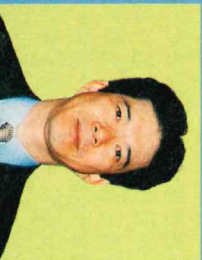
第92代副議長 沢飯英樹