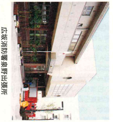
広坂消防署泉野出張所