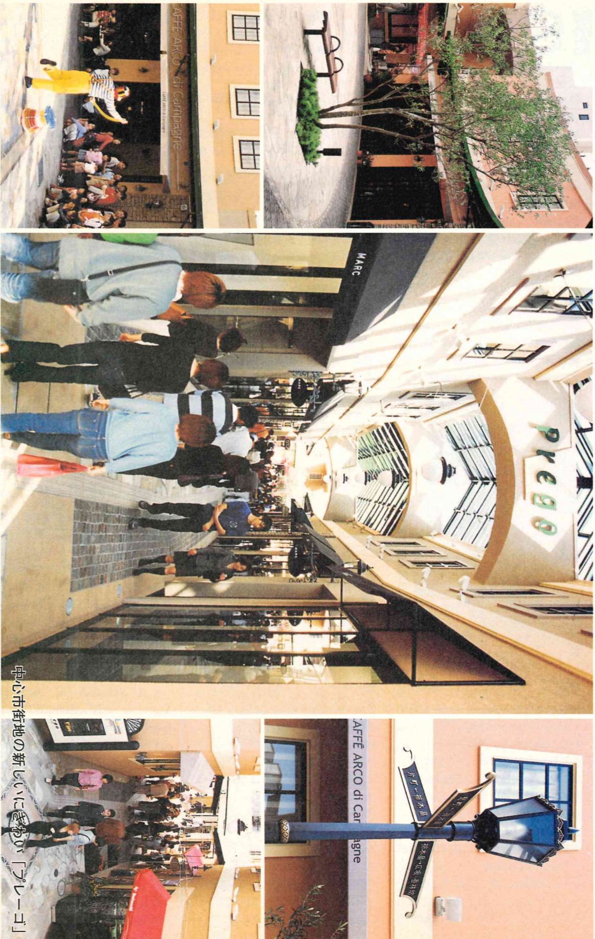
中心市街地の新しい「プレーゴ」

〈インターネットアドレス〉 http://www.city.kanazawa.ishkawa.jp/gikai/index.htm