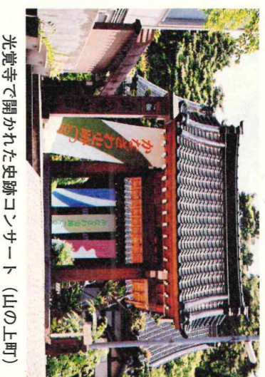
光覚寺で開かれた史跡コンサート (山の上町)

答弁 名目上の市債残高は、増加傾向にあるが、不沢対策として国の総務省に呼応するなどは大切と考えられている。しかし、交付税措置のある有利な起債を厳選した結果、市税負担は、市債残高全体の約四五％である。引き続き、市債残高の動向には、以上にも本市の固有性を留意監視を行い、起債の抑制努力や繰上償還の実施等により、適正な財政運営に努めたい。