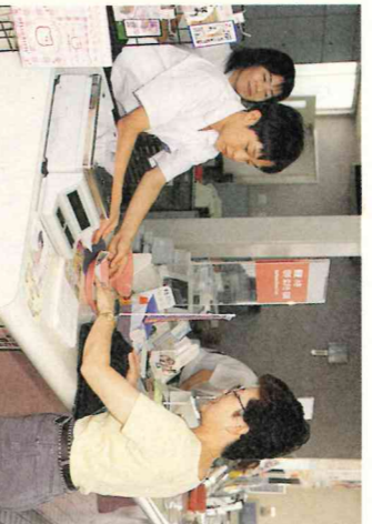
わく・ワーク体験 (問屋町郵便局)

職場体験をするものであるが、その準備のため、各学校の二年生担当者から、地域の活性化は住んでいることが重要であり、市はそのための力がかみずから計画づくりを始める味から、地域の活性化は住んでいる準備のため、各学校の二年生担当者として、この事業は大変忙しい状況である。この事業のことを折るか、本市は、この事業の課題と問題点はどこにあると考え