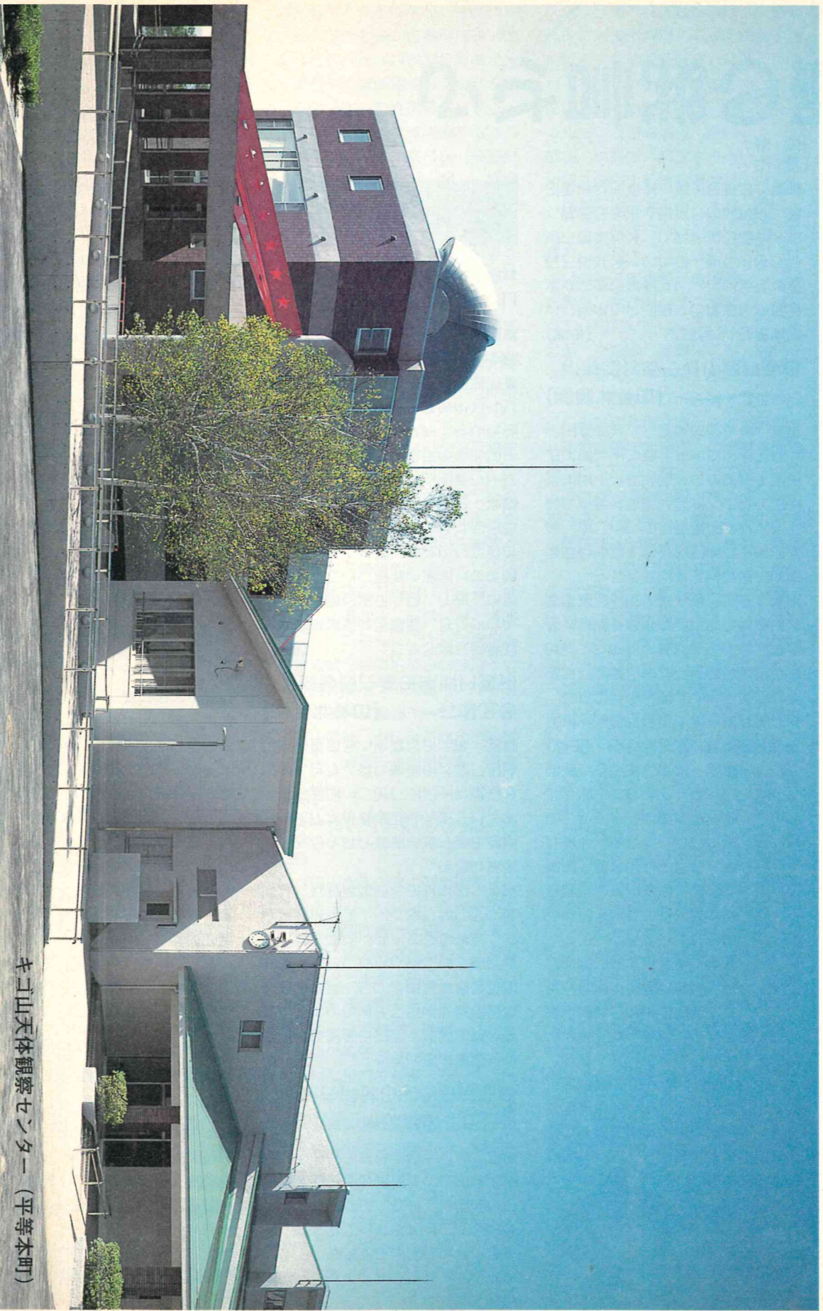
キコ山天体観察センター(平等本町)

平成10年(1998年)11月1日 編集●金沢市議会事務局 発行●金沢市議会 金沢市広坂1-1-1 ☎(076)220-2393 <インターネットアドレス> http://www.city.kanazawa.ishkawa.jp/gikai/index.htm