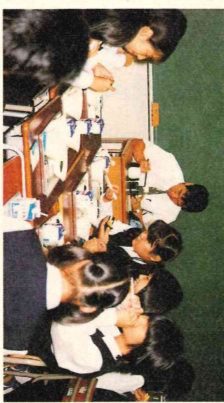
楽しい給食時間 (清泉中学校)