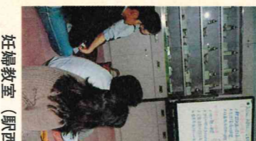
妊婦教室 (駅西福祉保健センター)

質間 多胎児は単胎児に比べ、早産が多く、虚弱であったり、障害を持つて産まれることもあり、母親には自身の健康とあわせ極めて不安の大きいものである。このことから妊婦中の指導、妊婦の把握、本市以外の実家での出産の指導は。