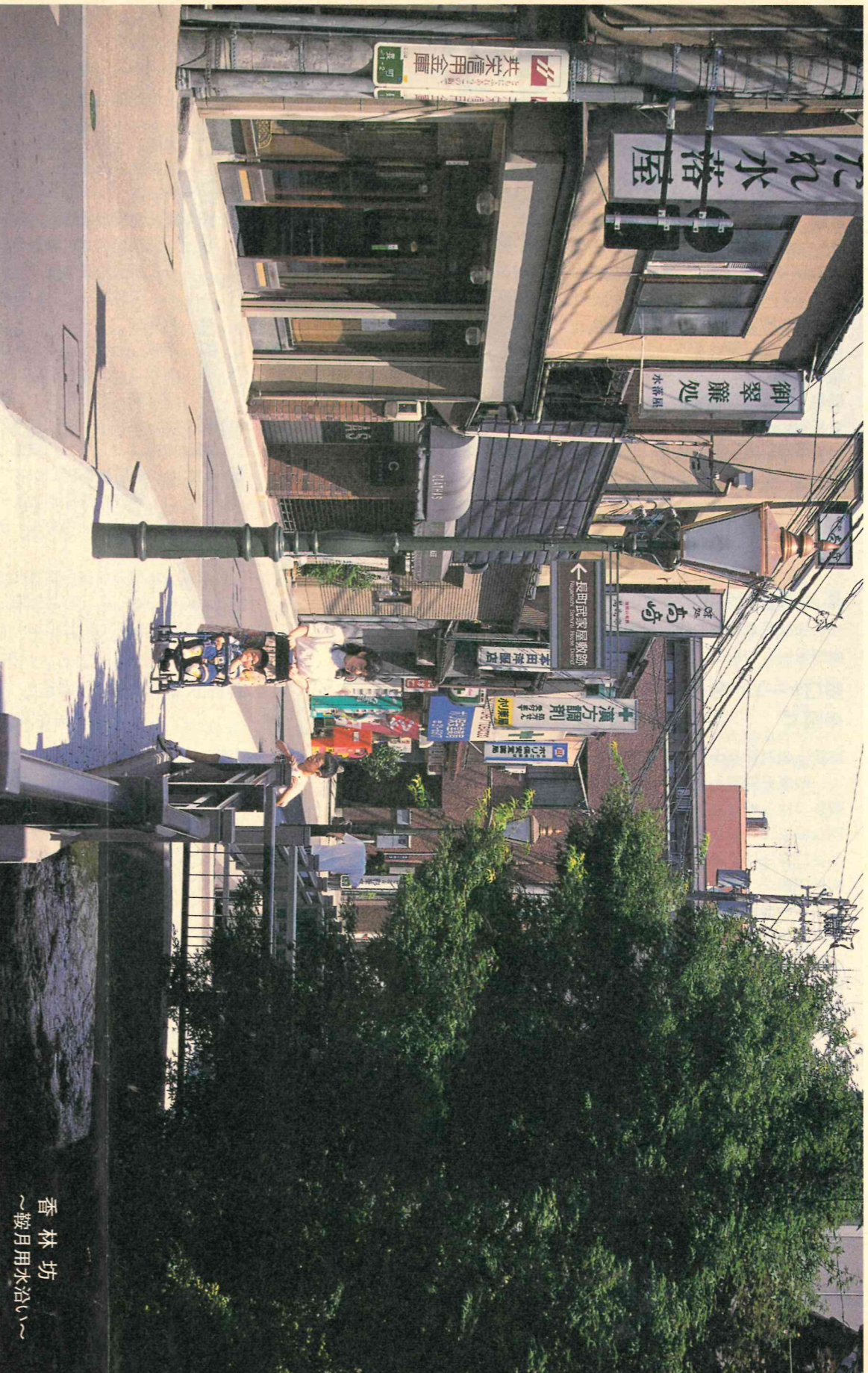
香林坊 ～鞍月用水沿い～

平成8年(1996年)8月1日 編集・金沢市議会事務局 発行・金沢市議会 金沢市広坂1-1-1 ☎(0762)20-2393