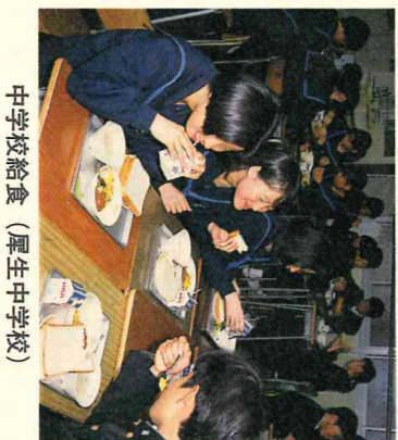
中学校給食 (厚生中学校)

質間 今回の国見山キツツバキの里の面積を拡大してほしいとの意見書が早くから提出されているが、基本構想を策定中であり、具体的な計画については八年度に行内となぐ、わずかな区域の指