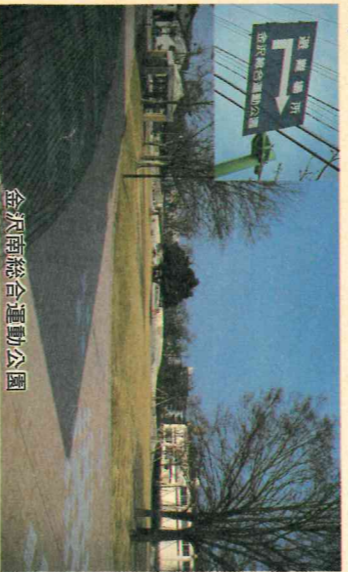
金沢南総合運動公園

答弁 本市の震災対策は震度6を想定して実施してきたが、震度7も想定したまちづくりを進めていかねければならない。国では現在、耐震指針の見直しが行われており、その推移を見ながら対処していく。被害を最小限に食い止めるには、地震発生時の初動体制のあり方が最も重要と認識しており、ライオンライオンの確保のための施設整備、防災関係機関との連絡体制、他自治体との協力体制、ボランティアの受け入れについても研究していきたい。