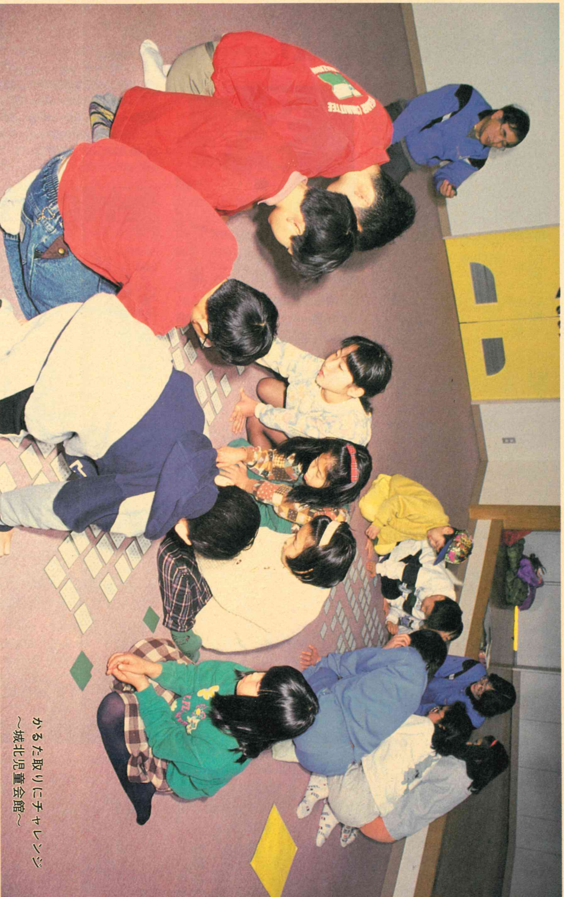
かるた取りにチャレンジ ～城北児童会館～

平成7年(1995年)2月1日 編集・金沢市議会事務局 発行・金沢市議会 〒920 金沢市広坂1-1-1 ☎(0762)20-2393