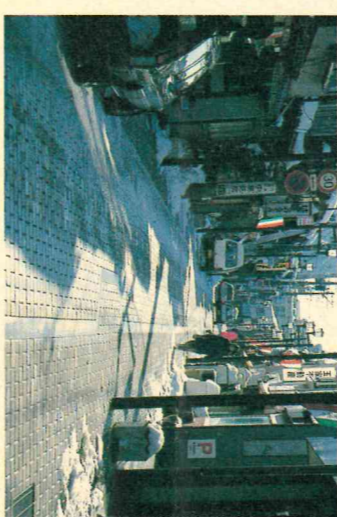
安全で快適な歩行環境を

質問 都心部の裏通りでは荷ざばき車の集中が歩行者の安全な往來を阻害している。歩行者、自転車等の安全で快適な道路空間とするため、遊休地の活用を含め積極的な荷ざばき駐車場の整備を歩行者優先道路として、荷ざばき車面等許可車しか通行できない交通規制を導入できないか。