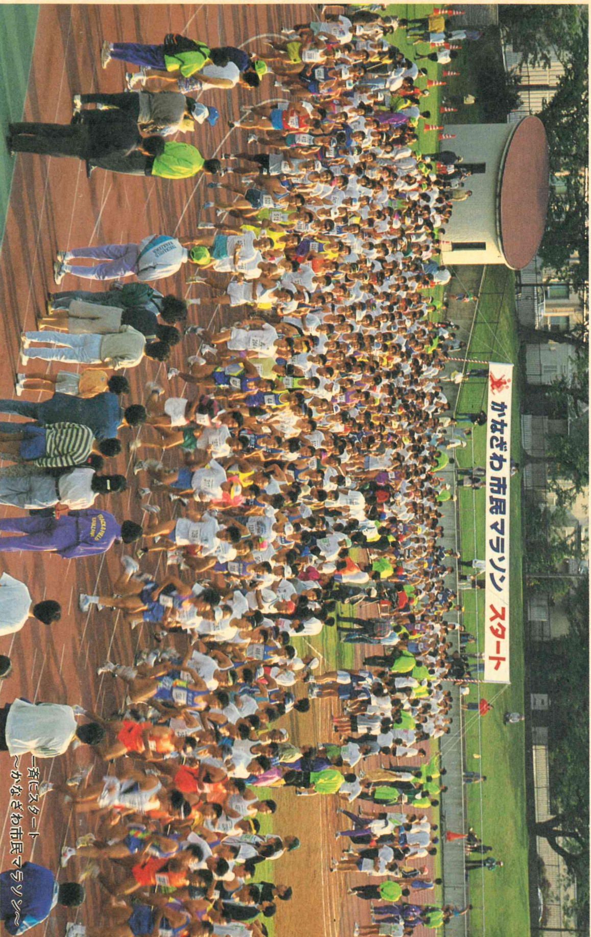
一斉にスタート ～かなざわ市民マラソン～

平成6年(1994年)10月25日 編集●金沢市議会事務局 発行●金沢市議会 〒920 金沢市広坂1-1-1 ☎(0762)20-2393