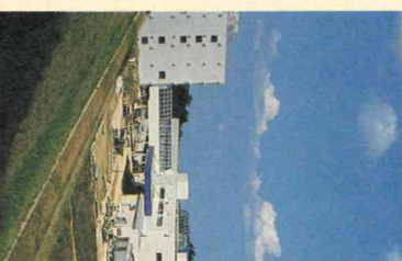
金沢テクノパーク