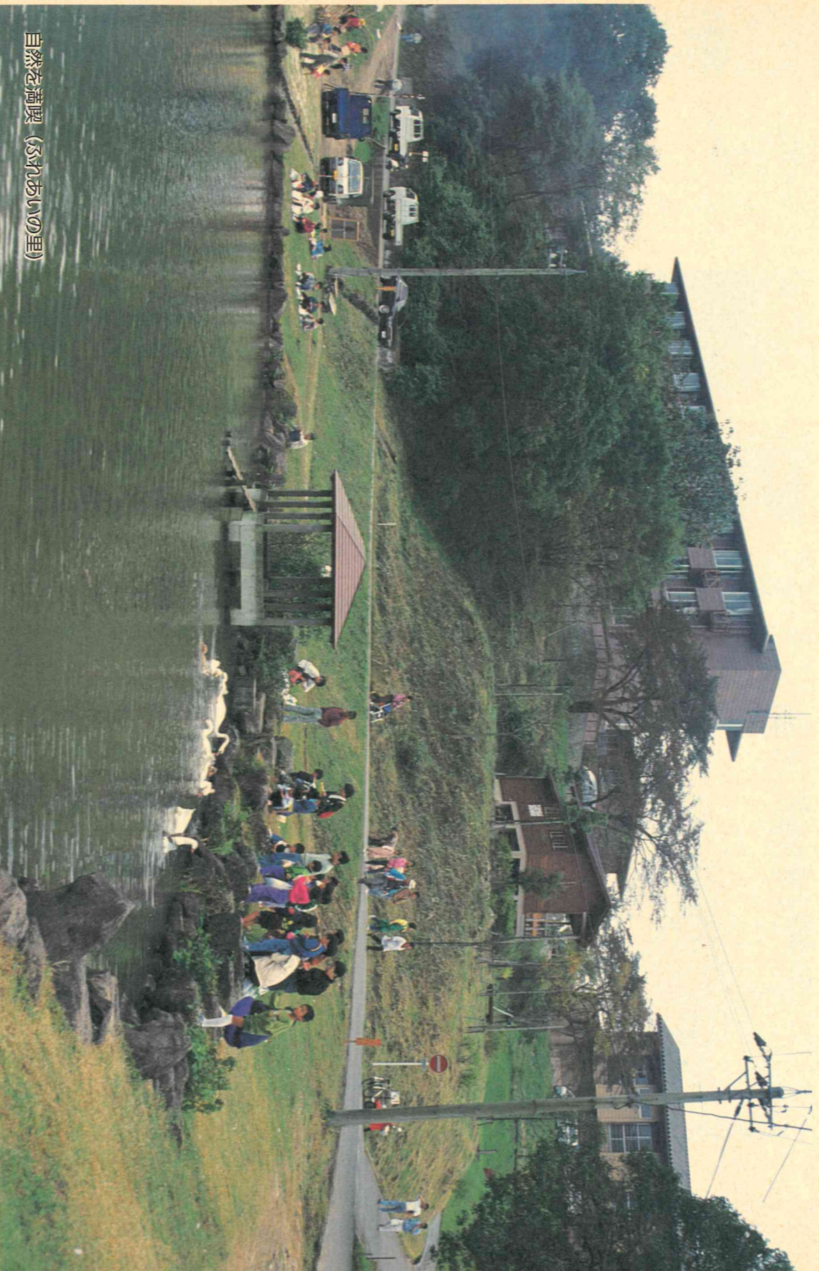
自然を満喫 (ふれあいの里)

平成5年(1993年)11月10日 編集●金沢市議会事務局 発行●金沢市議会 〒920 金沢市広坂1-1-1 ☎(0762)20-2393