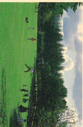
自然環境の保全にも重点

質問 県庁舎の改築の必然性の論議については、市長といつ立場から真重であるべきと思ってきた。週日の知事の移転公式表明や、県議会の委員会の状況を踏まえて、今後は移転に対処しなければならないと考えているところである。これからの推移に十分な関心を持ち、議会とも相談し、県と連携を図り、意見を述べ、適切に対処していきたい。(市長)