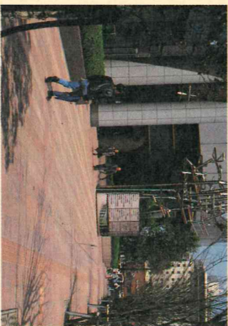
街並みにマッチする広告

◇わが国の半世紀は、ひたすら産業経済の拡大向上を求めた時代であった。私たちは世界有数の豊かなを手にした反面、心の豊かさを失い、環境破壊や中央主導の行政が、地方都市の個性を奪うなどの問題を生じた。また、高齢化社会をかつてない速さで迎えている。◇私たちはこれから、経済優先から生活重視に、開発主導から環境との調和へ、画一化から多様化へと発想の転換を図らなければならない。しかも、多様性に富む生活重視の行政は、それぞれの地方がそれぞれの地域の特性を生かしながら、地方主導の自主的、創造的な活動によって実現されるものであり、今日、本市のよきな中核拠点都市の役割と責任が大きく問われている。◇金沢は豊かな自然と、先人たちが贈られた優れた学術・文化とそれに裏付けられた産業がある。この貴重な個性と資産を守り育て、これに新たな創造と革新を注ぎ、さらに磨き高めたい。そこに経済と生活、開発と保全が調和し、心の通った福祉社会が形づくられると考える。◇「都市はそこに住むものすべての芸術作品」と言われる。開かれた市政の中で、市民みんなの力で活力と個性に満ちた幸せな21世紀都市金沢を実現したい。◇五年度の予算編成に当たっては、特に、現在の景気の対応を最優先課題として、緊急融資の拡大と住宅、下水道など生活重視の公共事業の確保を心がけ、地域経済の安定化、活性化に配慮した。