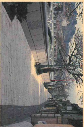
整備された旧主計画