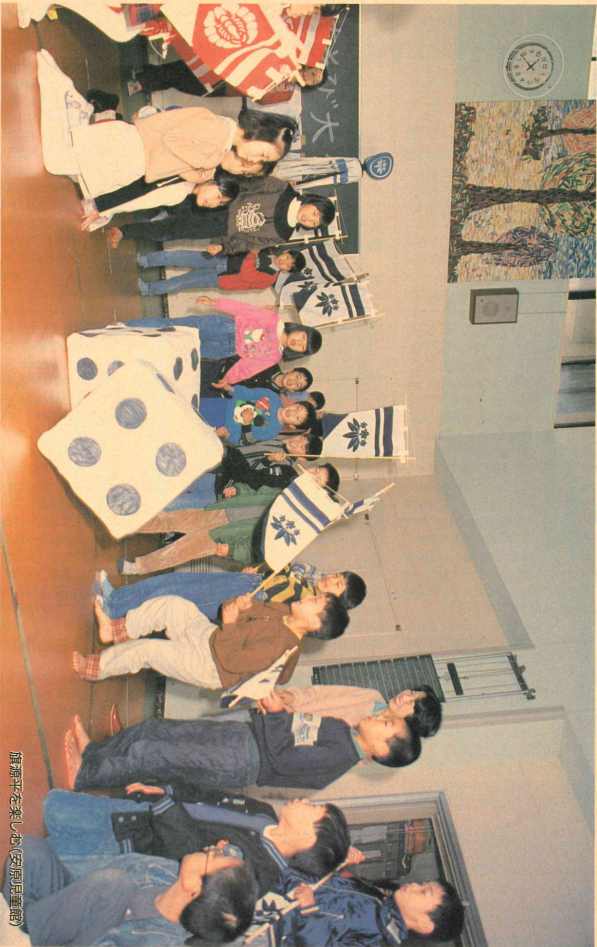
旗源平を楽しむ(安原児童館)

平成5年2月10日 編集●金沢市議会事務局 発行●金沢市議会 〒920 金沢市広坂1-1-1 ☎(0762)20-2393