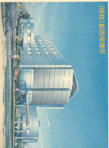
(仮称) 新西保健ビル