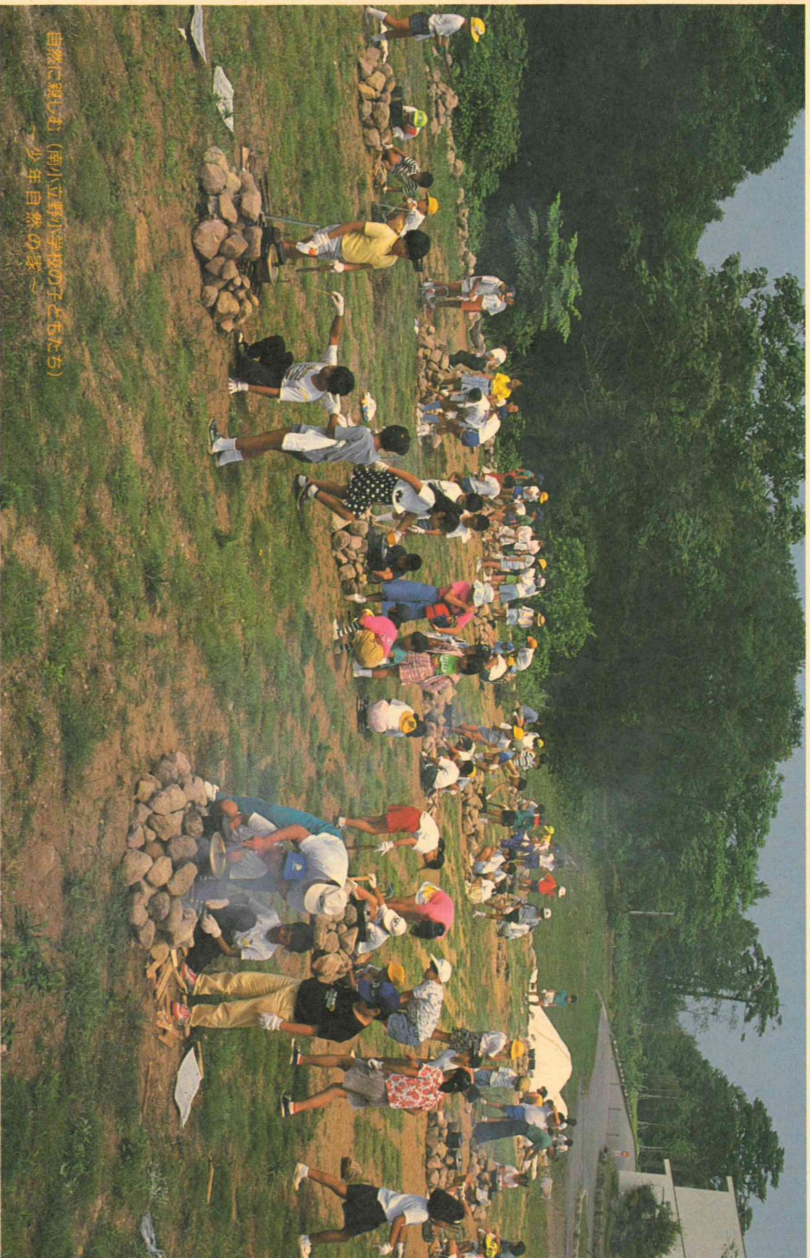
自然に親しむ (南小立野小学校の子どもたち) 少年自然の家

平成4年8月10日 編集●金沢市議会事務局 発行●金沢市議会 〒920 金沢市広坂1-1-1 ☎(0762)20-2393