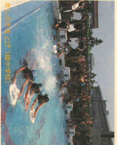
水泳教室を上げ(緑小学校)

■地球環境保全に関する意見書 予算の増額を行うよう要望する。 ■一般財源の大幅な投入と補助事業予算の増額を行うよう要望する。 地球サミットで採択された「リネア宣言」と、その行動計画「アジェンダ21」や「生物多様性条約」などの実現のため、経済社会活動と地球環境の調和を旨とした環境法制度を整備することともに、早急に所要の実行施策を進め、環境に関する国民の啓発活動により一層努められるよう要望する。 ■学校週5日制に伴う条件整備に関する意見書 学校週5日制の円滑な実施に向け、家庭、地域の理解を得るよう努めるとともに、子供たちの主体的活動を奨励するための具体的な方策を早急に確立し、生涯にわたり真にゆとりある学習ができる教育環境のより一層の整備充実を図られるよう要望する。 ■第一次道路整備五箇年計画の策定と大幅な事業費の確保に関する意見書 第十一次道路整備五箇年計画の策定に当たり、都市づくり事業を促進するための総投資規模を大幅に拡大し、道路特定財源の確保、充実並びに、短期的には、第七次廃棄物処理施設整備五か年計画の速やかな進