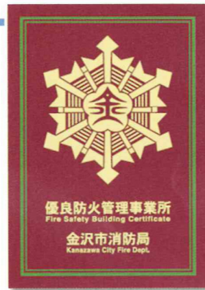
(優良防火管理事業所認定証)

建物に「優良防火管理事業所認定証」が掲出されることにより、優れた防火管理を実施していることを建物利用者へ情報提供できます。