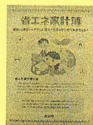
電気使用量等の報告 (省エネ家計簿)