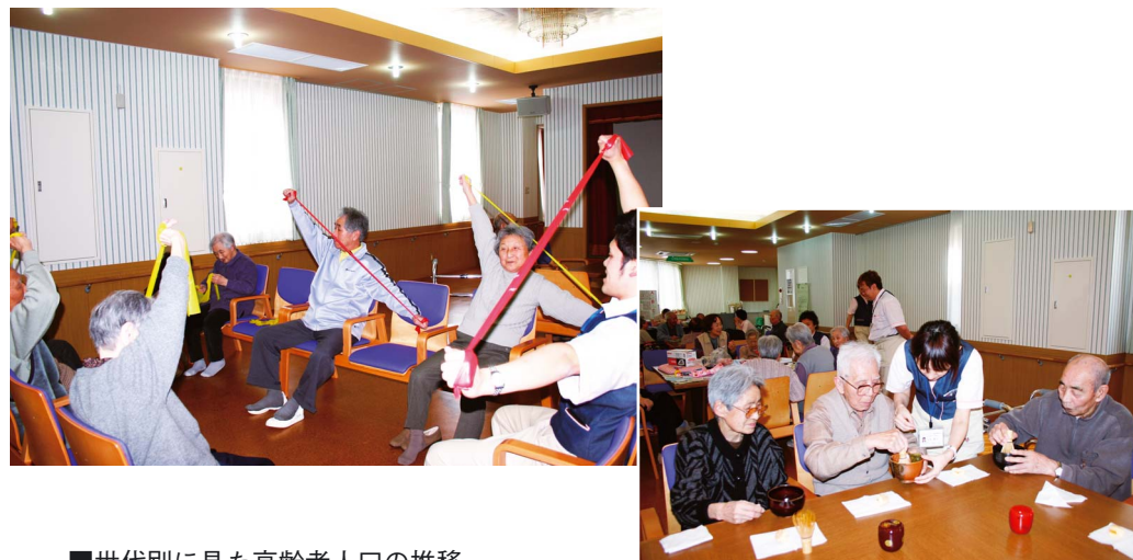
■ 世代別に見た高齢者人口の推移

まうことから、介護予防に向けた取り組みを進めるとともに、介護が必要になっても自らの意志により住み慣れた地域でその人らしく暮らせる体制の確立が求められています。