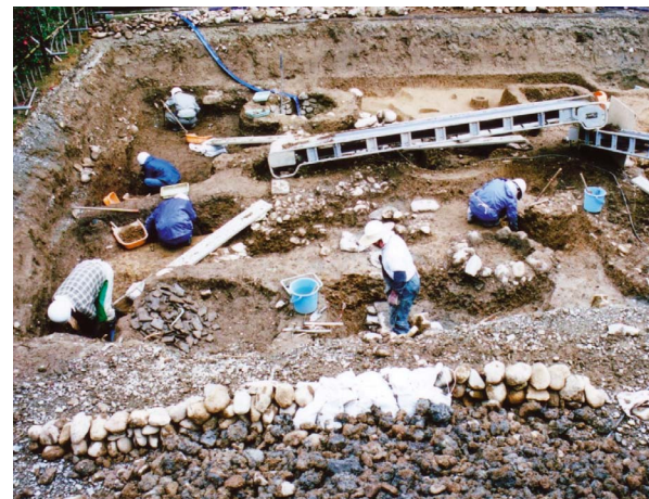
シルバー人材センター会員による遺跡発掘作業