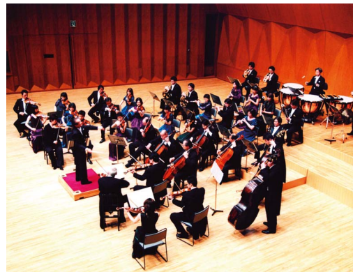
オーケストラアンサンブル金沢

りを積極的に進めてきました。今後はこれらの施設の利用機会の拡大や施設間の連携機会をつくり出していくとともに、伝統文化と新たな文化の融合による多様な文化・芸術活動の推進が求められています。