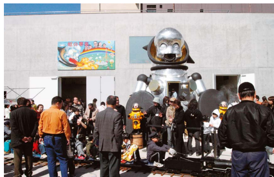
ヤノバケンジ『子供都市-虹の要塞-』（2005年）

り、新しい金沢の魅力と活力を創出していきます。美術館は教育、エンターテインメント、コミュニケーションの場など、新たな「まちの広場」としての役割を果たすとともに、市民や産業界など様々な組織と連携を図り、新しい美術館活動を展開します。また、オーケストラ・アンサンブル金沢や市民芸術村と連携しながら、発表の場としても活用していきます。