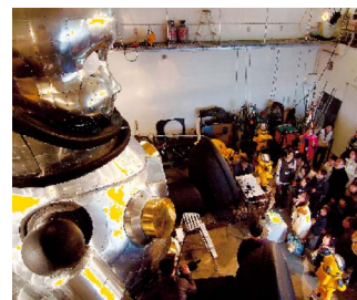
プロジェクト工房