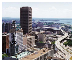
バッファロー市 (アメリカ合衆国)