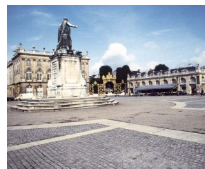
ナンシー市 (フランス共和国)