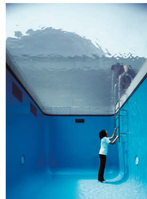
レアンドロ・エルリッヒ《スイミング・プール》2004年