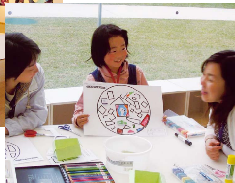
キッズスタジオワークショップ