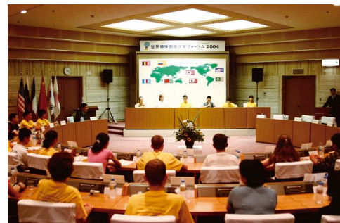
世界姉妹都市少年フォーラム

金沢市は現在、世界7都市と姉妹都市 * 提携を結んでおり、幅広い分野で友好的な交流事業を実施しています。今後、ますます地域社会の国際化・グローバル化が進むと予想されることから、市民一人ひとりが互いの立場や歴史、文化、習慣等の差を理解し合えるような国際性を涵養する環境を整えとともに、外国人市民が暮らしやすい多文化共生社会の構築が求められています。また、友好交流だけでなく、産業や文化、学術等の分野での戦略的交流も進める必要があります。