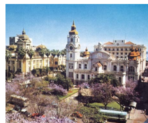
ポルト・アレグレ市 (ブラジル連邦共和国)