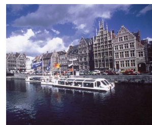
ゲント市 (ベルギー王国)