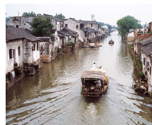
蘇州市 (中華人民共和国)