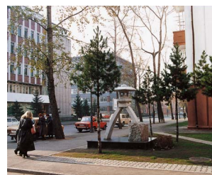
イルクーツク市 (ロシア連邦)