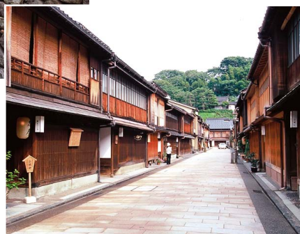
伝統的建造物群保存地区