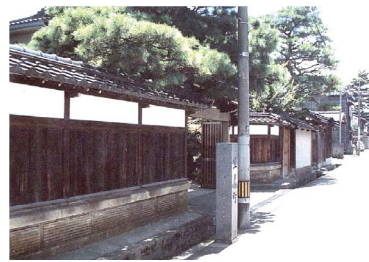
こまちなみの保存