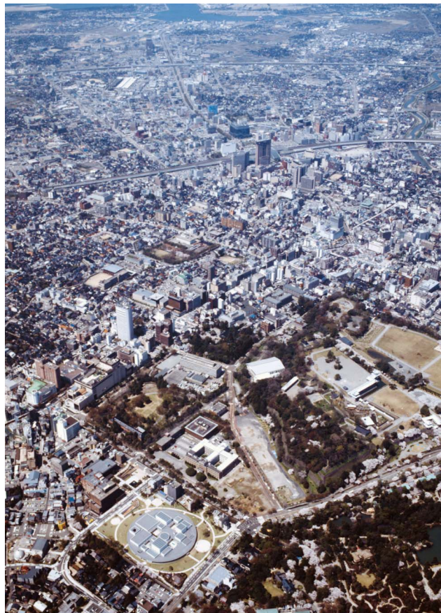
上空から見た金沢の中心街