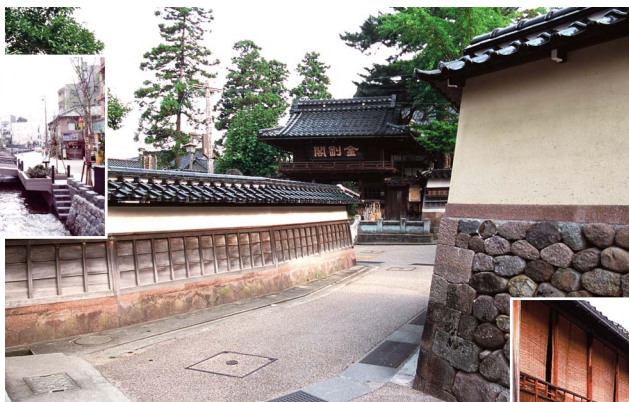
寺社風景 (卯辰山山麓寺院群)