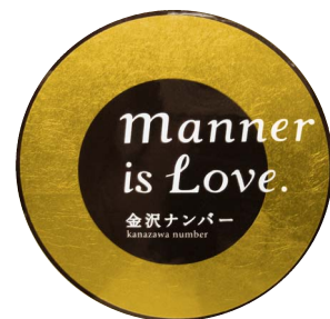
金沢ナンバー特製ステッカー「マナー・リング」