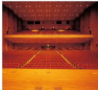
観光会館大ホール

や活性化にも一役を担っています。今後、北陸新幹線の開通によって首都圏との交通事情が良くなり、コンベンションの誘致においてもさらに優位な状況になると思われます。しかし現在大規模な国際会議場がないため、国際会議・国際学会等を誘致することが難しい状況にあります。