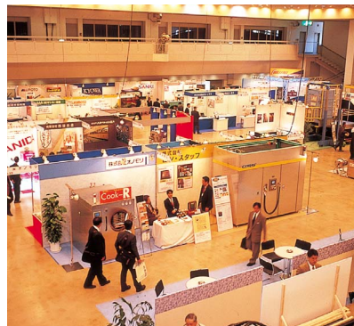
機械工業見本市金沢