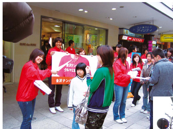
金沢ナンバーキャンバスサポーターによる「サポーターズクラブ」のPR活動

金沢市・かほく市・津幡町・内灘町の2市2町で設立した「金沢ナンバー連絡協議会」を母体に、自動車の「金沢ナンバー」の普及推進を図るとともに、地域振興策や交通マナー向上策を進めることで、都市ブランドとしての「金沢」の知名度をさらに高めていくことが重要です。