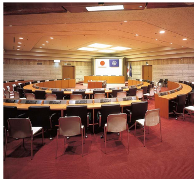
文化ホール大会議場