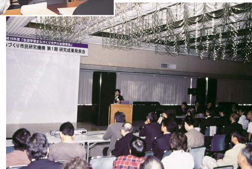
1年間の研究成果を発表する市民研究員