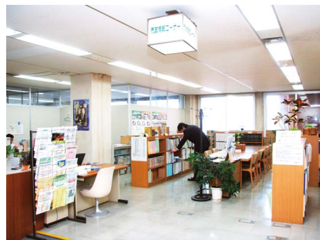
市政情報コーナー

平成17（2005）年4月に制定した「金沢市における市民参加及び協働の推進に関する条例」に基づき、市民参加と協働を進めるための推進計画を策定するとともに、施策を総合的に推進していくことが求められています。