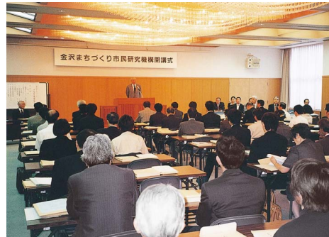
金沢まちづくり市民研究機構開講式