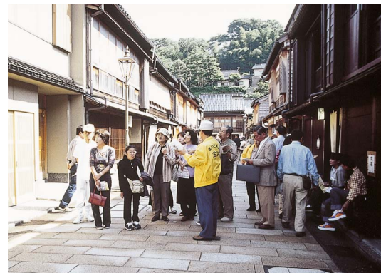
金沢ボランティア大学校を修了し、活動する観光ボランティアガイドの「まいどさん」