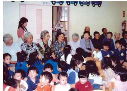
第三善隣館でのお年寄り子ども達の交流