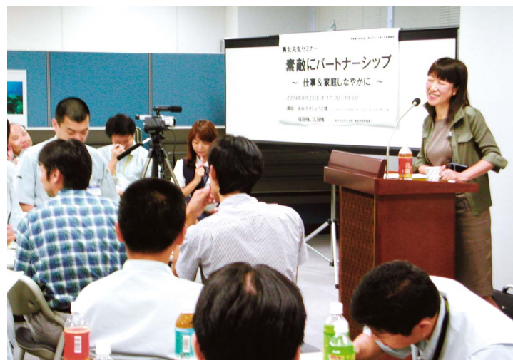
男女共同参画出前講座

さ、女性に対する暴力への社会の無理解など多くの課題があることから、引き続き施策の推進に取り組んでいく必要があります。