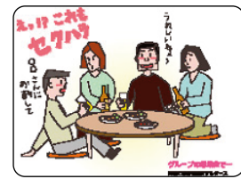
セクシャル・ハラスメント