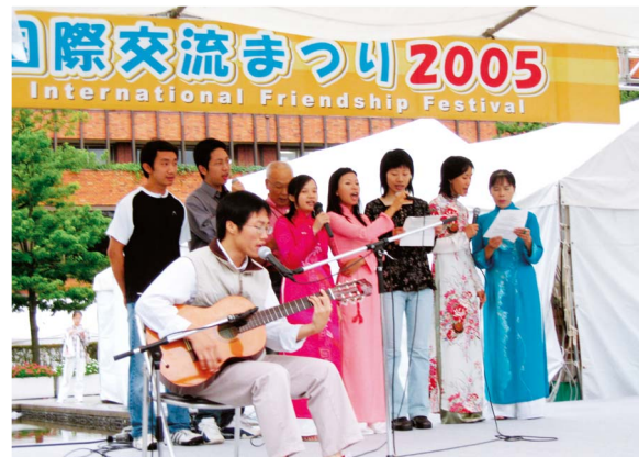
国際理解を深める国際交流まつり

見や差別などの人権問題が起きています。また、インターネットを悪用した問題、犯罪被害者の問題など新たに取り組まなければならない多くの課題が生じています。