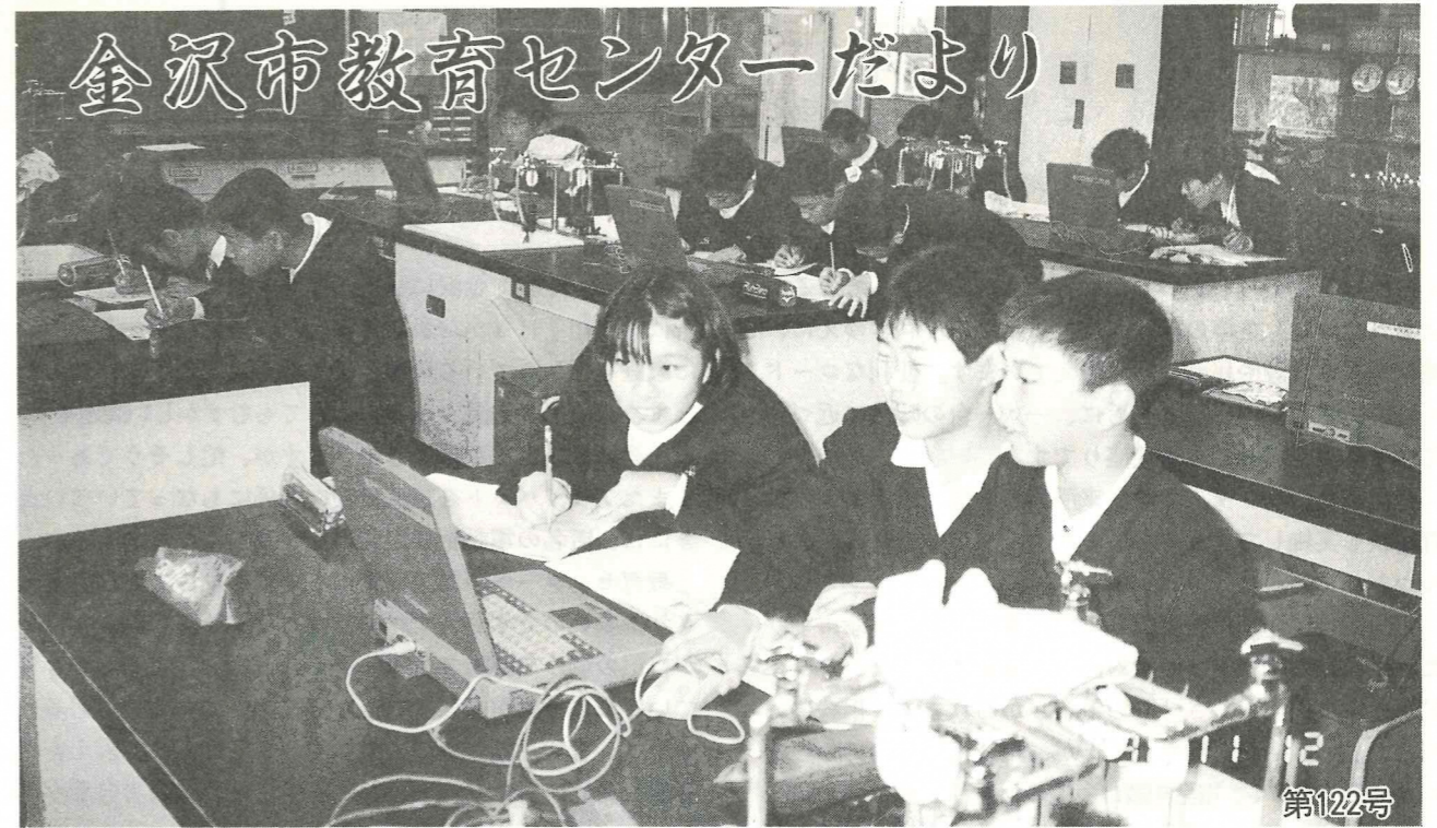
写真：浅野川小学校6年理科「ヒトとかんきょう」での授業風景 (H8.11.12) 平成8年12月12日発行