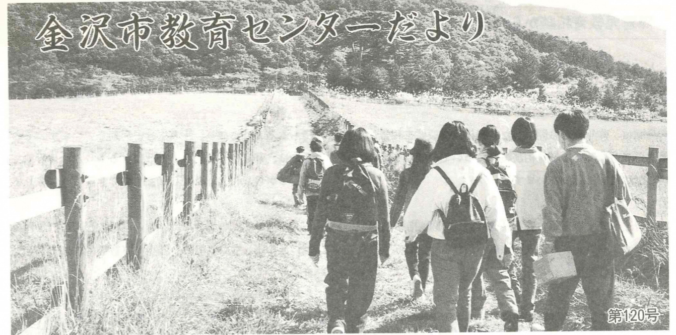
写真:「そだち」わらび取り遠足 -キゴ山にて-

発行者 金沢市教育センター 南 千 之 〒920 金沢市武蔵町14番31号 TEL (21) 7949-1642 FAX (21) 6800 URL http://www.iaa.or.jp/ed-center/ e-mail ed-center@kanazawa.iaa.or.jp