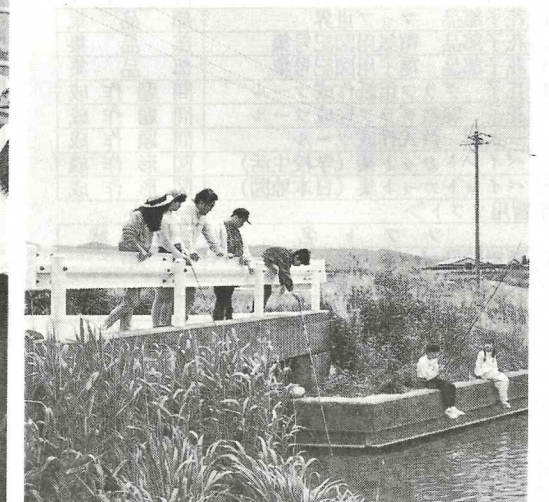
— 楽しかった魚つり —