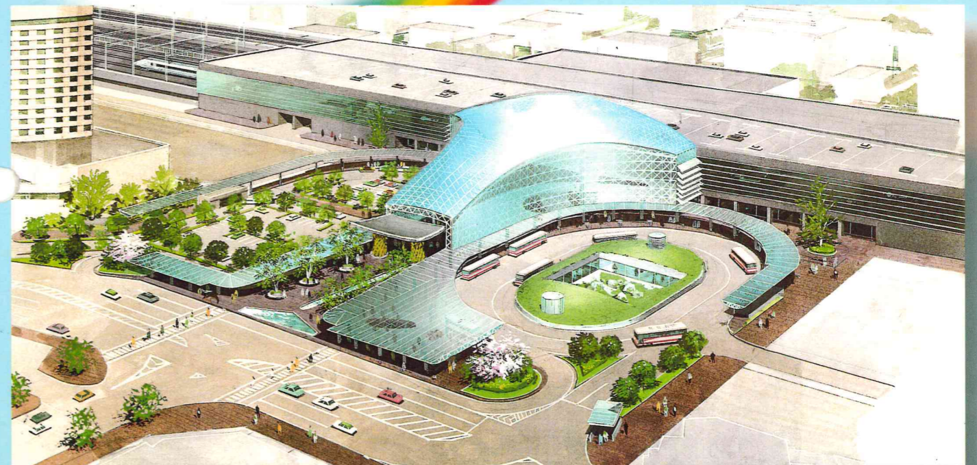
(金沢駅東広場 完成予想図)