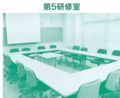
有線でインターネット接続ができる環境もあります。