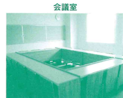
石川県の間伐材を活用した机、椅子を設置しており、コンパクトで少人数用です。