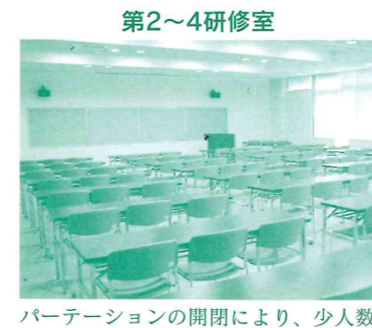
パーティションの開閉により、少人数から156人までの研修、講演会等に使えます。