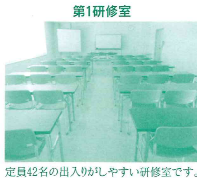
定員42名の出入りがしやすい研修室です。